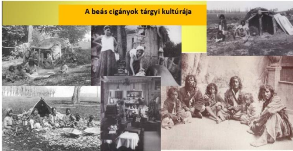
2. ábra: A beás cigányok tárgyi kultúrája

hagyományait. Munkájukra jellemző a kézművesipari tevékenység, de vannak, akik mezőgazdasággal foglalkoznak. Korábban teknővajással, fakanál készítésével és kosárfonással foglalkoztak leginkább. A cigány, roma népesség mindössze 8%-át teszik ki.