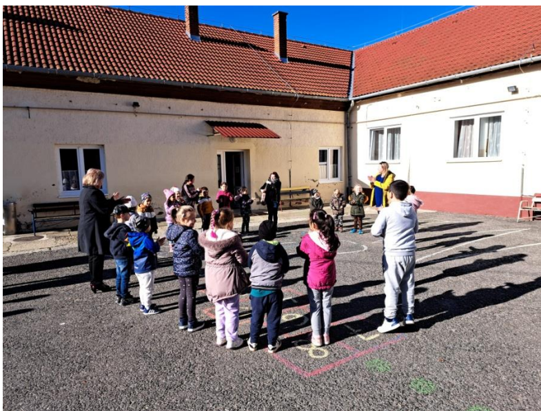
17-19. ábra: Óvoda-iskola átmenetet támogató közös program