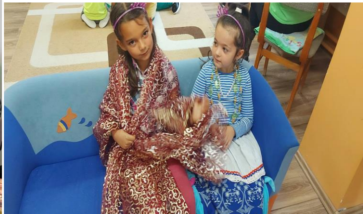
3-7. árba: Roma hagyományőrző nap az óvodában