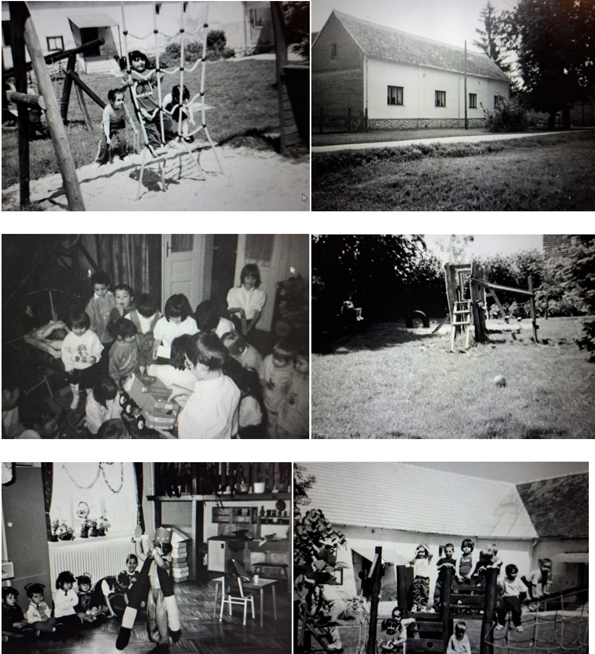
8-13. ábra: Képek az 1984-1990-es évekből

Felsőmindszenten az óvodát 1964-ben alapították, Godisán 1974-ben. Előtte Godisán csak nyári óvodai elhelyezést biztosítottak a gyerekek számára. Mindkét óvoda egy-egy osztatlan csoporttal működött, kezdetben félnapos rendszerben.