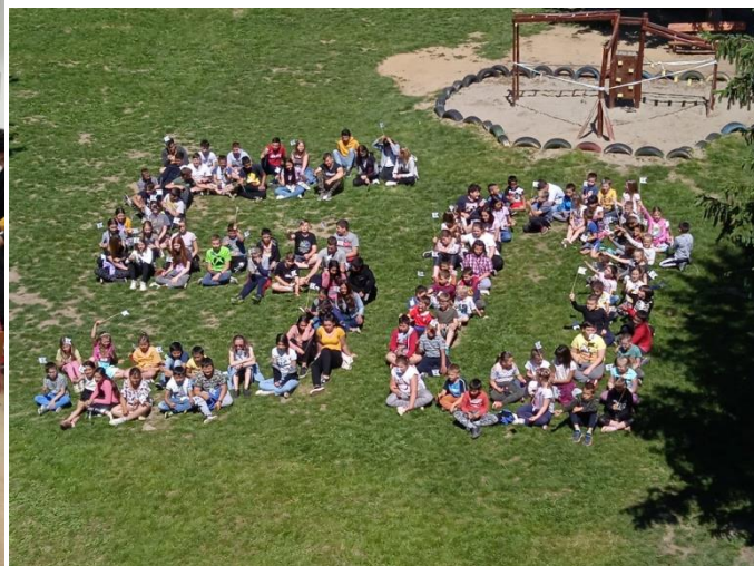
20-23. ábra: Képek a 2010-2023-as évekből