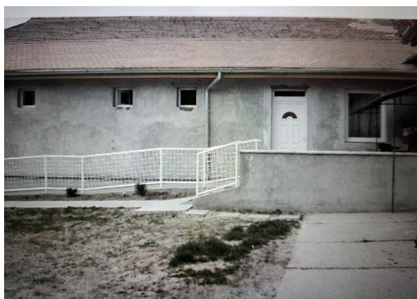
14-16. ábra: Képek a 2000-es évekből