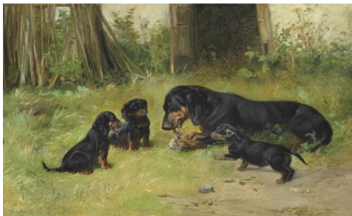
2. kép: Tacsókók egy régi festményen (Max Liebermann munkája, forrás http11. )

Napjainkban a munka- és a küllemvonalak teljesen elkülönültek, nemcsak az országban, de külföldön is. Sajnos a tenyésztők jelentős része munkája során a könnyebb utat választja, csak a küllemi megjelenésre koncentrálnak és szelektálnak, amivel természetesen jelentős kárt okoz a fajtának, hiszen ha vissza kívánjuk hozni a kívánatos vadásztulajdonságokat, ahhoz hosszú évek munkája szükséges, tudatos szelekcióval. Az ilyen kutyák alkatilag gyengék, izomzatuk és csontozatuk kevés, alkatuk nem megfelelő a vadászatra, idegzetük gyenge, orrjóságuk nem megfelelő, szenvedélyük gyenge, nem kitartóak. Dr. Engelmann szerint, a vadászatilag közepes vagy hideg tacskozó olyan, mint a töltény lőpor nélkül ( http8. )