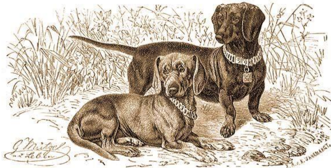
1. kép: Tacsókó Brehm Tierleben című könyvében (1895).

megfeleltetése mindannyiunk felelőssége, akik ezt a fajtát tartjuk, tenyésztjük vagy vadászatra használjuk.