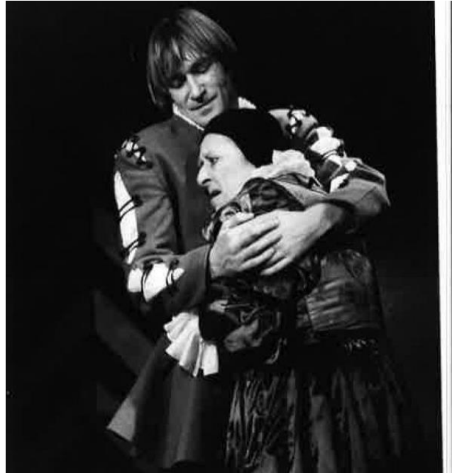
5. ábra: Cserhalmi György és Gobbi Hilda (Tóth 1984)

köszönhetően, a megírt szerepnél hálásabbnak tűnt; karakterét nagy intellektuális fölény és virtuóz fizikai mozgás jellemezte, melyet pontosan, feszesen, hatalmas energiákat felemészítve formált. Cserhalmi a drámai események viharában, nem ment el a poénok lehetősége mellett sem (Csáki 1984).