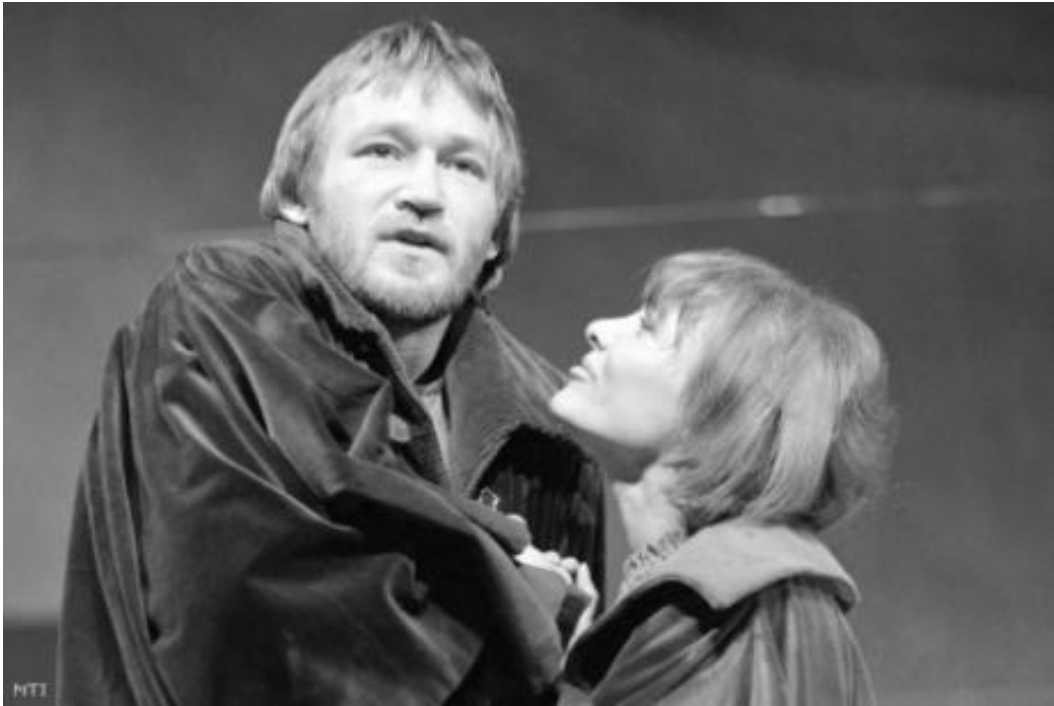
3. ábra: Cserhalmi György és Töröcsik Mari (Benkő 1978)

Cserhalmi György 1975-ben visszatért a Csokonai Nemzeti Színházba, ahol további két évadot töltött (Huszár 2018), majd 1977-1979 között a Nemzeti Színházban játszott (3. ábra) és a színészi munkák mellett a Magyar Filmgyártó Vállalat színészeként tevékenykedett (Huszár 2018), egészen 1983-ig, amikor az akkor megújuló és önálló színházként debütáló Katona József Színház alapítótagjai közé hívta Székely Gábor és Zsámbéki Gábor (sz.n. 2023), a teátrum csapatát 1989-ig erősítette Cserhalmi, majd Székely Gábor távozásakor újra a Nemzeti Színházban formálta szerepeit, mindeközben Balikó Tamással megalapította a Labdatér Teátrumot, melynek a Globe kulturális centrum adott otthont (sz.n. 2018a). Cserhalmi fél évet tartózkodott Amerikában, majd 1994-ben Székely Gábor az Arany János Színházból létrehozott Új Színházba hívta alapítótagnak (sz.n. 2018a). Cserhalmi György 1999-től a Radnóti Miklós színházban alkotott 4 éven át (Huszár 2018). 2013-ban a székesfehérvári Vörösmarty Színházba szerződött Cserhalmi György, ahol az ott töltött 5 évben a színészi munkákon túl, rendezéssel is foglalkozott. (Huszár 2018) 2017-ben Móricz Zsigmond: Úri Muri című darabjában láthatta volna a Nemzeti Színház közönsége Cserhalmit, azonban egészségügyi állapota ezt nem tette lehetővé, a darabot nélküle kellett bemutatni (sz.n. 2017).