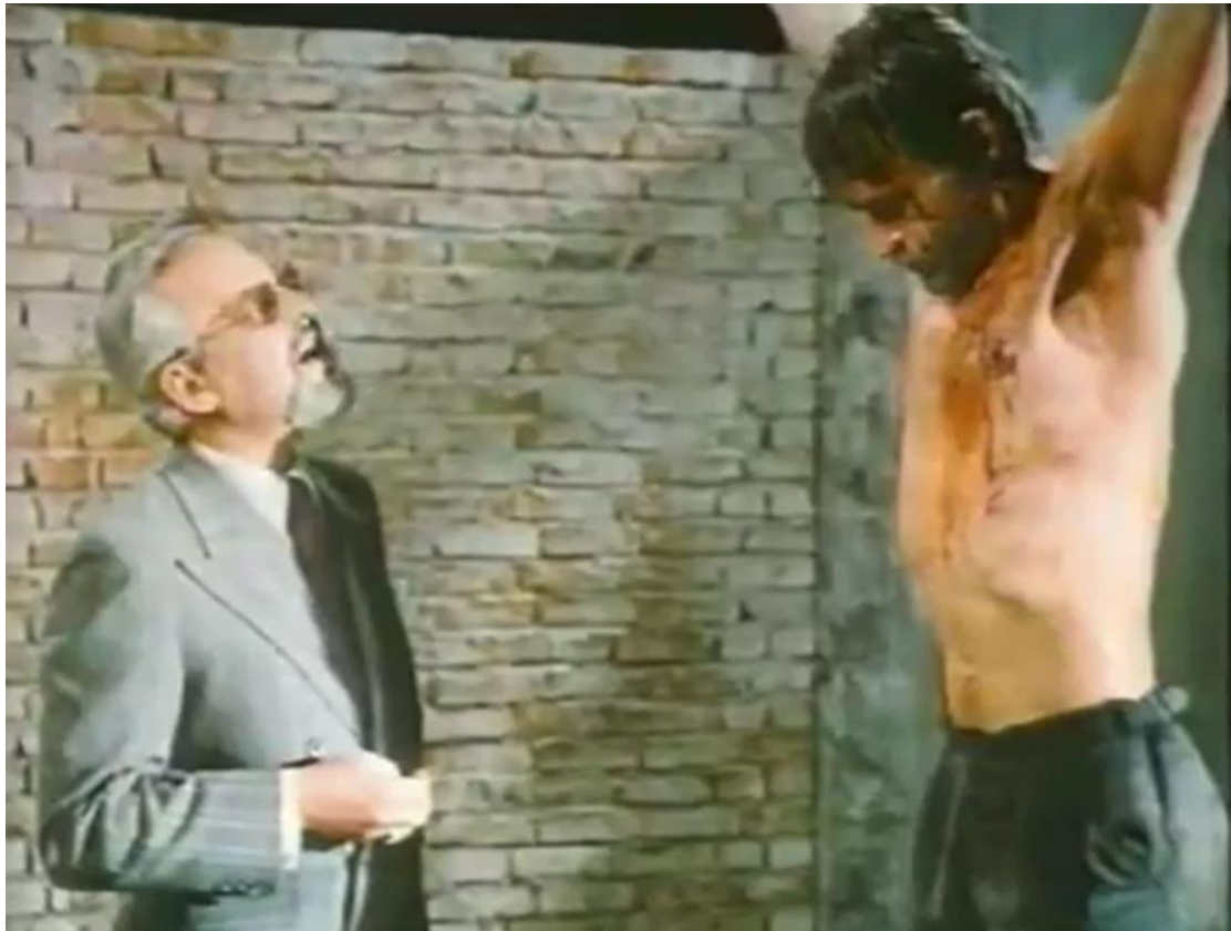
2. ábra: Latinovits Zoltán és Cserhalmi György Az ötödik pecsét című film forgatásán (Illés 1976)

adódott meg neki a lehetőség, hogy Latinovits Zoltánnal közösen léphessen színpadra (Almási 1977), aki Cserhalmit "szakmai fiává" fogadta (Varga 2011). Az élményről Cserhalmi azt nyilatkozta: "Nádasdy Kálmán azt mondta nekem, Zoli mindig apát keresett magának, mert nem volt egy igazi apaképe. Helyette Veszprémben talált egy fiút és felépített magában egy apaszerepet. Ebből az apaszerepből közeledett hozzám, és nekem pedig jólesett, hogy van egy szakmai apukám." (2. ábra) (Varga 2011).