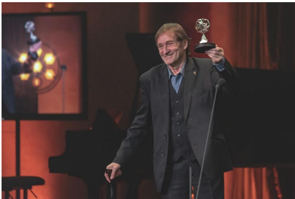
13. ábra: Cserhalmi György a Filmakadémia Életműdíjának átvételekor (Sulyok 2020)

Cserhalmi György kiemelkedő színművészként, sokoldalú játékaival, a szakma iránti elkötelezettségével és páratlan tehetségével több évtizednyi színházi és filmes munkássága során számtalan díjat, elismerést tudhatott magáénak. A karakterek egyedisége, saját magáévá formálása, mélysége és hitelessége nem csak a közönséget, de a kritikusokat, szakmabelieket is lenyűgözte (5. sz. melléklet).