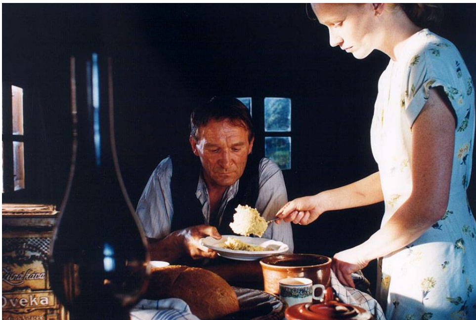
12. ábra: Cserhalmi György és Anna Geislerová a Zelary című filmben (Spelda 2003)

Cserhalmi nemzetközileg is elismertté vált, Európában és Amerikában is foglalkoztatták, egyebek között Cseh filmekben, ezek közül példaként a Zelary (12. ábra) című világháborús témájú produkcióban, melyet Ondrej Trojan rendezett és amit 2004-ben Oscar-díjra jelöltek (Lee 2020).