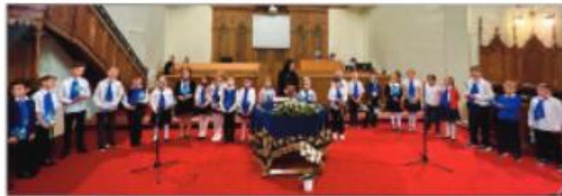
Templomi anyák napi műsor 2. a osztály

Iskolánk alsó tagozatán minden évfolyam nagy izgalommal, lelkesedéssel és szeretettel készült az egyik legszebb ünnepünkre: anyák napjára. A 2. a osztályosok a május 7-i istentiszteleten műsorral köszöntötték az édesanyákat és a nagymamákat. Megható, szép műsoruk könnyet csalt sok édesanya szemébe. 2. b osztályosaink Zselickisfaludon ünnepeltek. Az apukák szalonnasütéssel tették még felejthetlenebbé ezt a napot. A legkisebbjeink aranyos versekkel és dalokkal készültek, amit közösen adtak elő az anyukáknak. Virágokkal díszített üdvözlőlapot adtak ajándékba, azután vidám játékokat játszottak. A 3. a osztály saját készítésű süttivel és pogácsával várta az anyukákat Zselickisfaludon, majd vidám, verses-dalos meglepetés műsorral is készültek. A 3. b osztály a diszteremben