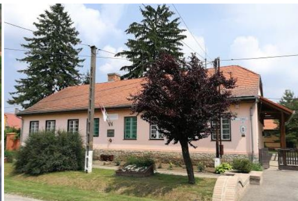
2-3. kép: Balra a nagyharsányi, jobbra a drávafoki általános iskola