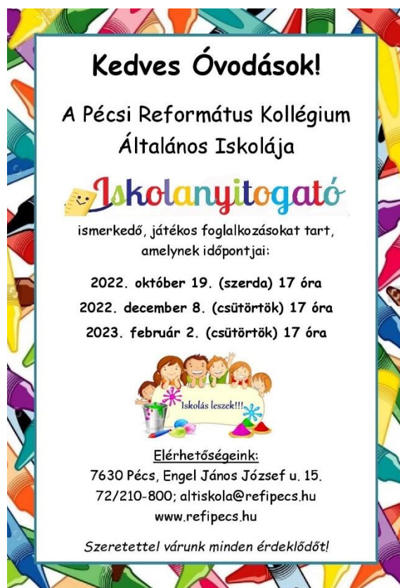
5. kép: Pécs 2022/23-as plakátja

Nagyharsányban egy kiválóan kidolgozott, a Nyitva van az Aranykapu címet viselő programsorozattal próbálták az iskolába csábítani a leendő elsősöket. Egy lényeges eltérés a pécsi gyakorlathoz képest, hogy jóval több időt töltöttek az ovisokkal iskolai kereteken kívül is: nem csupán elmentek a helyi óvodába, hanem saját programjaikra is hívták a kicsiket és szüleit