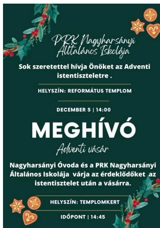
7. kép: Nagyharsány 2022/23-as vásári plakátja

A bál az alkalomhoz illően díszített sportcsarnokunkban kerül megrendezésre. Svédasztalos étkezés, ital- és süteményes pult, zenekar, pálinka- és sütemény verseny... minden adott a jó hangulathoz. Minden bál előtt az iskola pedagógusi közössége megfogalmaz egy célt arra vonatkozólag, hogy a bevételt mire fordítsuk. Ezt megvitatja a szülői munkaközösség, s amennyiben egyet értenek, a megfogalmazott cél hivatalossá válik. Hagyomány, hogy – mivel a bál