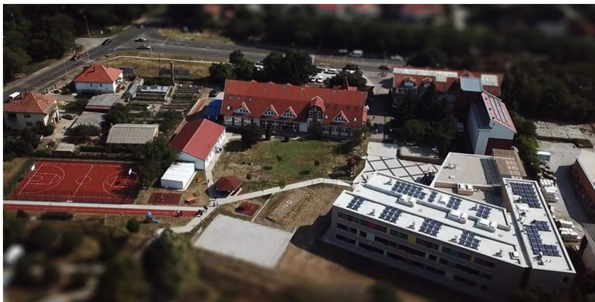
1. kép: A Kollégium telephelye a magasból – közepén a középiskola, jobbra fent az internátus tömbje, jobbra lent az általános iskola új épülete

1999-ben a gimnázium, 2019-ben pedig (a Széchenyi 2020 program keretében kiírt és megnyert pályázatnak köszönhetően) a pécsi általános iskola költözhetett új épületbe. (1. kép 2 )