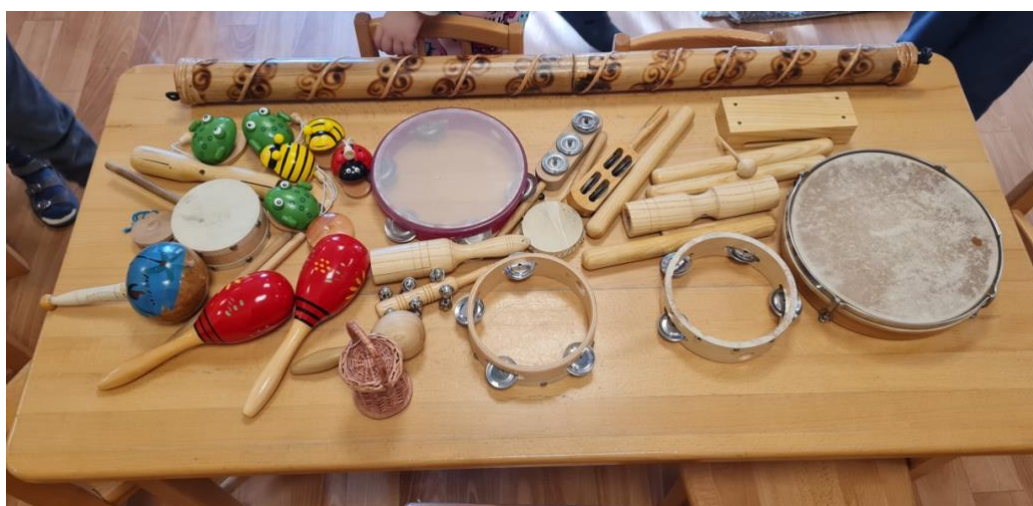
2.ábra: Vihar imitáló eszközök

Kiosztottam a gyerekeknek a hangszereket (például: állatos kasztanyetták, csörgődob, rumbatök), ők pedig egyesével megszólaltathatták őket, miközben elmondtam nekik, hogy melyik micsoda és, hogy az adott hangszer a viharnek melyik hangja lesz.