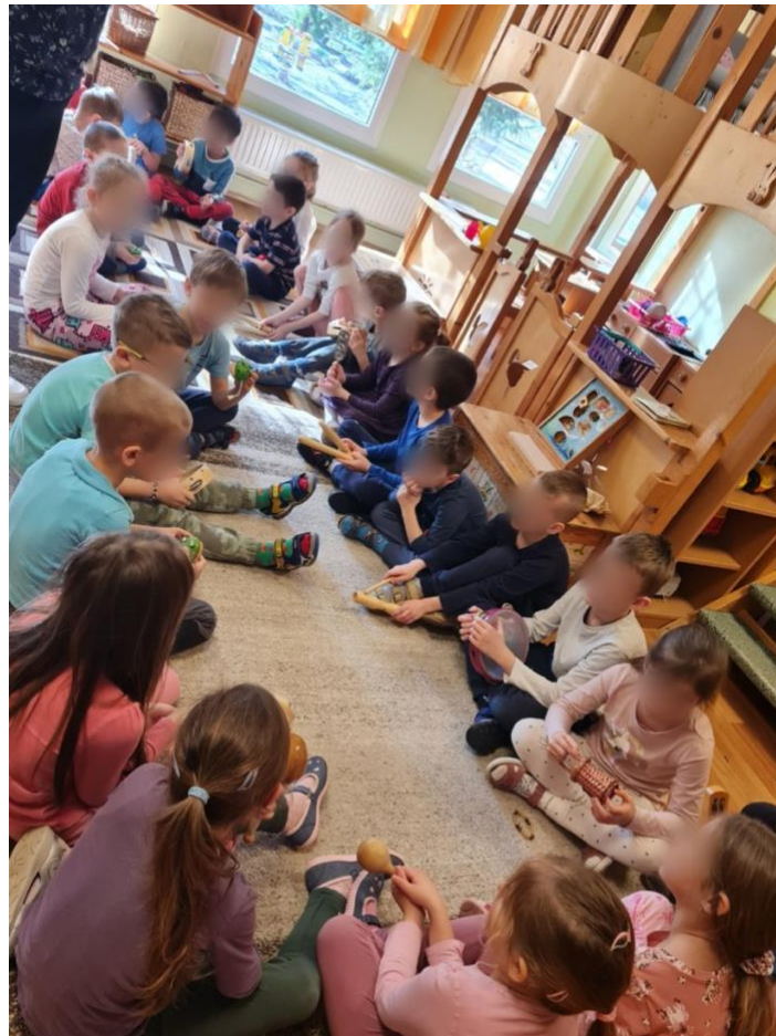
3.ábra: Közös vihar imitálás hangszerekkel

Ezt követően az előzetesen megismert relációjelnek megfelelő halk-hangos hangok kézzel, térben mutatását újból megbeszéltük. A gyerekeknek az volt a feladata, hogy figyelniük kellett a kezeimet: ahogyan nyitottam vagy zártam a kezemet, az alapján kellett hangosan vagy pedig halkán megszólaltatni egyszerre az összes hangszert.