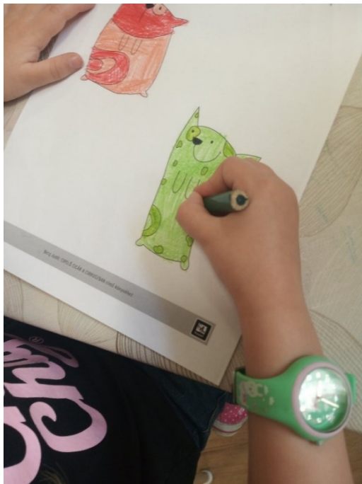
8. ábra - Színezés