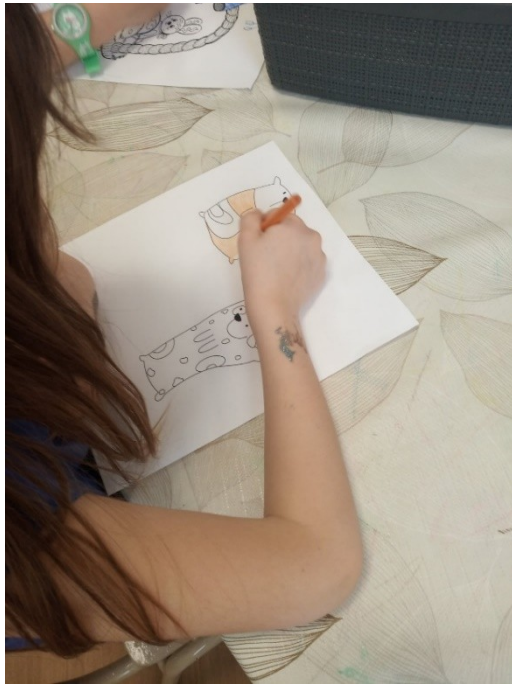
6. ábra - Színezés

A mese végén a könyvet körbe adtam, bárki megnézhetné, lapozgathatta. Készítettem a gyerekeknek színezőt, illetve a nagyobbak lerajzolhatták kedvenc karakterüket is. Könyvjelzőket is készíthettek, amiket a foglalkozás végén lamináltam és hazavihettek ajándékba, ezzel is ösztönözve a szülőket a mesék olvasására.