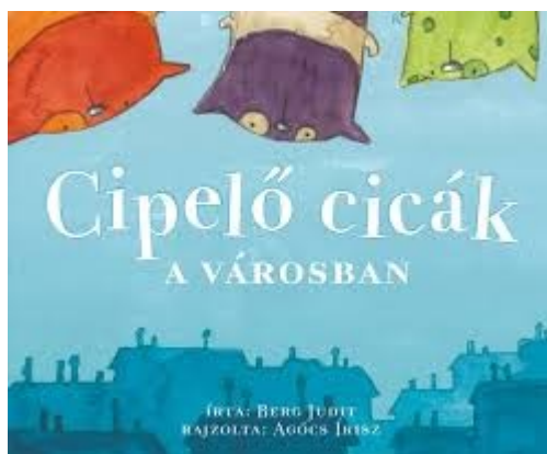
1. ábra: Cipelő cicák – A városban

A Cipelő cicák a városban című könyv 2008-ban jelent meg a Pozsonyi Pagony gondozásában. A mű négy alfejezetre tagolódik, ahol kezdetét veszi egy átlagos család nem mindennapi kalandja. Első részében - a Ki fog rendet rakni? - tipikus gyerekszobában találjuk magunkat, ahol a játékok között felbukkannak a mese főhősei is: Ciró, Pepe és Lóri. Minden cicához egy kisgyermek tartozik: Lili, a hétéves iskolás, a narancsos színben pompázó Ciró