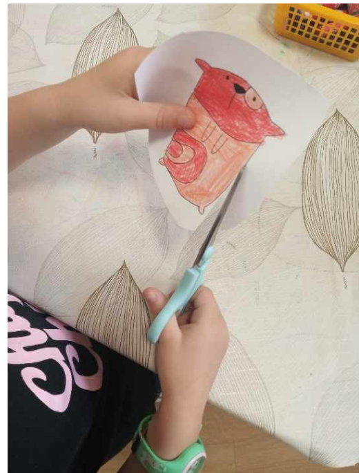
9. ábra - Kivágás