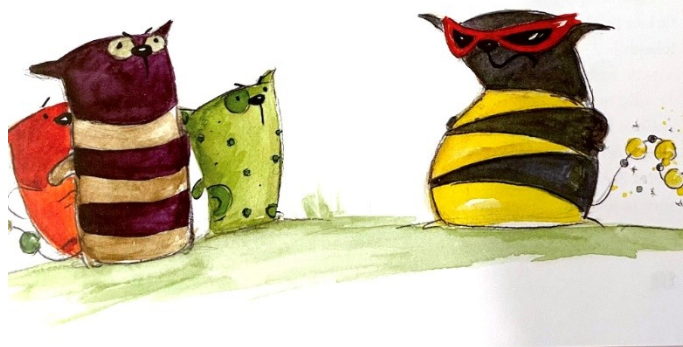
5. ábra - Cipelő cicák a cirkuszban

– Pepe, Lóri, csakhogy itt vagytok. Baj van! – Mi történt veled? – kérdezik a cicák kórusban. De mielőtt Ciró bármit is mondhatna, éles hang reccsen a hátuk mögött. Sárga-szürke csíkos, napszemüveges macska áll mögöttük, fenyegetően görbülő, gyöngyös farokkal. Éppolyan Cipelő cicának látszik, mint Ciróék, mégis barátságtalanul méregeti a három megszeppent barátot. – Ez az én strandom, ha nem tudnátok! Nem tűrök meg idegent! – Ki vagy te? – tátja el a száját Lóri. – Nevem Zserbó. A többi nem tartozik rátok. Elég annyi, hogy többet nem akarlak itt látni titeket.