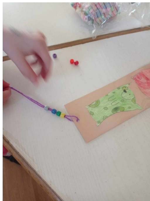
11. ábra – Gyöngyök felfűzése