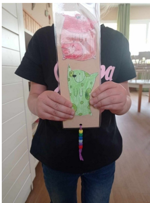
12. ábra - Könyvjelző