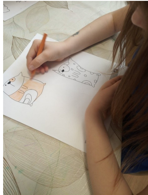
7. ábra - Színezés