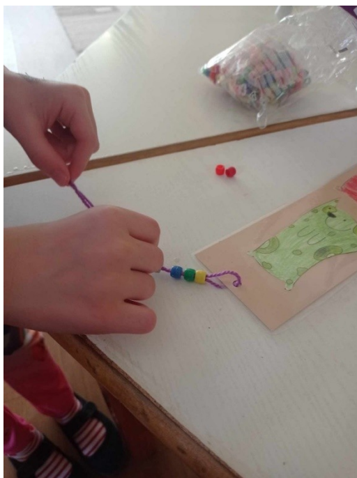
10. ábra – Gyöngyök felfűzése