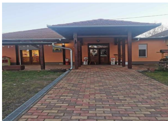
4. ábra: A felújított épületrész