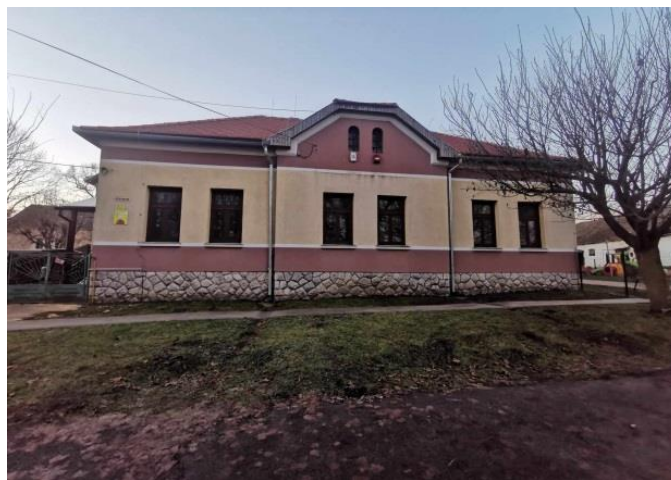
3. ábra: Az óvoda épülete (utcafront)

Az intézmény a falu központjában, az iskola és a körjegyzőség szomszédságában található (3-4. ábra). A község hátrányos helyzetű település, lakossága kb. 1200 fő. Az óvodába járó gyermekek többsége vásárosdombói, de jelentős számban járnak községünkől 6-8 km-re fekvő kisebb településekről is. A gyermeklétszám évek óta 65 fő körül van. Háromcsoportos óvodaként, vegyes életszervezéssel működik. A gyerekek különböző hátérrel és különböző területeken eltérő fejlettséggel érkeznek, ezeket a különbségeket igyekszik az intézmény csökkenteni, illetve megszüntetni.