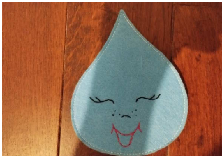
7. kép: Rohonczi Zsófia (2024): Vízcsepp, Drávamenti Óvodák Bolhói Óvoda