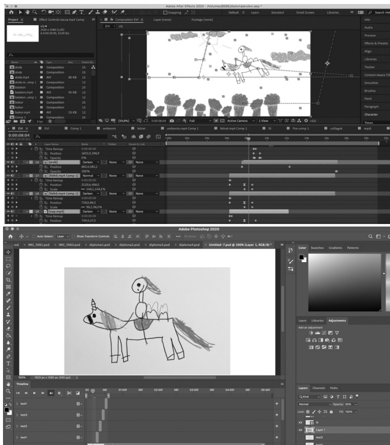
6-7. Ábra: Az utómunka folyamat képernyőfelvételei (adobe photoshop és after effects)