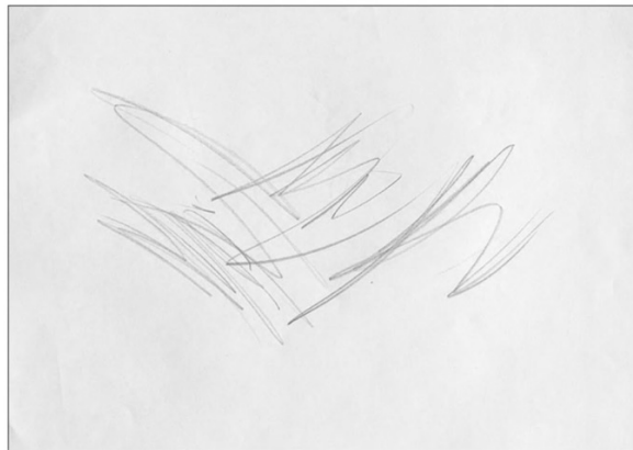
3. Ábra: Szálfafírka

Későbbi alapkarakter az úgynevezett szálfafírka és lengőfírka. Ezek használata indulatot gerjeszt a kisgyermekben. Céltalan mozgással, indulattal teli. Rajzolgatása közben a gyerekek gyakran megnyugszanak, megnő biztonságérzetük, feszültségük levezetődik. Fontos megjegyezni azt is, hogy a szálfafírka egyben alapját képezi az egyenesnek, a szabályos, szögletes geometrikus formáknak.