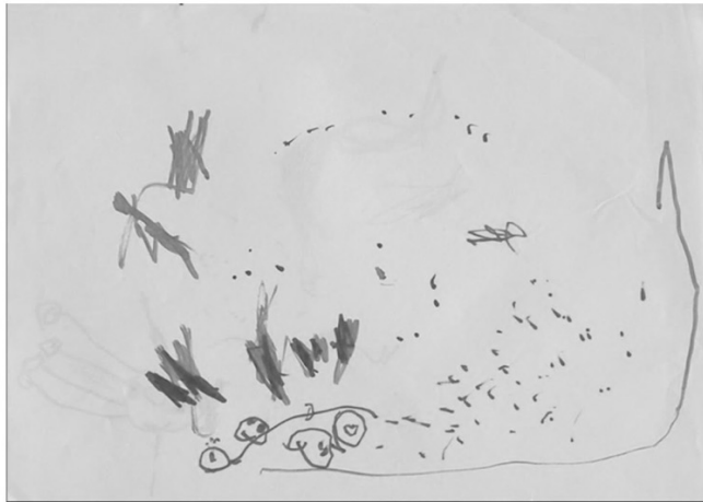
4. Ábra: Pont

Negyedik alapkaraktere a firkáknak az úgynevezett vándorló vonal, a folyamat átélése. A kisgyermek ezt az alapkaraktert kevésbé indulatatosan használja a többihez képest.