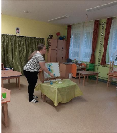
23. kép: Festés a mesemondás közben