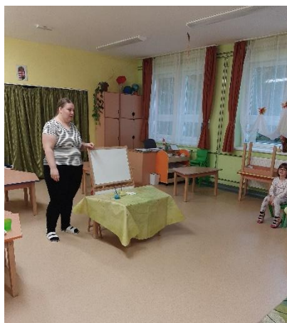
22. kép: Előkészületek a festés közbeni meséléshez