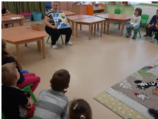
20. kép: Mesepárnás mesefeldolgozás