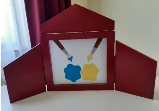
6. kép: Ecsetek és festékfoltok a Papírszínház 2. oldalán