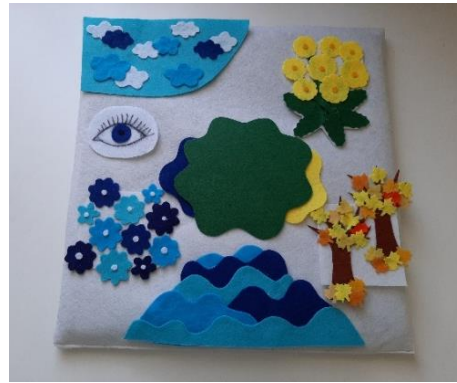
13. kép: Mesepárna az összes elemével