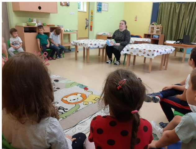
1. kép: Lázár Ervin: A Kék meg a Sárga című meséjének mesehallgatása (saját kép)

Reflexió: A csoport óvodapedagógusaival először közösen átbeszéltük a tevékenység megvalósítását, tanácsaikkal segítségemre voltak a gyermekcsoport motiválását illetően. A mesélést megelőzően néhány napot a gyermekekkel töltöttem, hogy jobban megismerhessenek, megszokhassanak engem és én is őket, bár óvodai gyakorlataim alkalmával többségükkel már volt lehetőségünk megismerkedni, közösen játszani, tevékenykedni. Már a mesebemutatókat megelőző napokban megfigyeltük, megneveztük és összehasonlítottuk az őket körülvevő eszközök, tárgyak, játékszerek színét. Az óvodaudvaron az udvari játékok színein kívül megfigyeltük a természet színeit is, és a környékbeli séták alkalmával is lelkesen hívtam fel a figyelmüket a különböző színekre. Rajzolás közben is beszélgettünk a színekről, mi milyen színű, ki mit rajzolt, azt milyen színűre színezi ki. Festés során próbálkoztunk a színek összekeverésével, amelyet nagyon élveztek a gyerekek. Kipróbáltuk és megbeszéltük milyen színek segítségével, mely új színeket tudunk előállítani. Sötétítettük és világosítottuk is a festékeket, hogy megtapasztalhassuk, mennyi féle árnyalata lehet egy színnek.