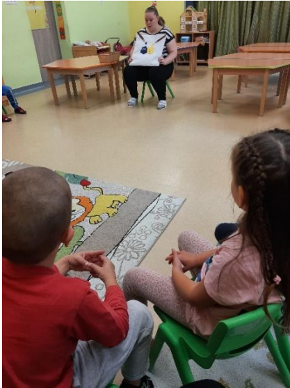
18. kép: A gyerekek megpillanthatják a Mesepárnán a festékpöttyöket