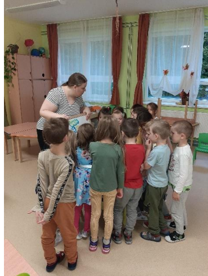
24. kép: Az elkészült festmény közös szemügyre vétele közelebbről