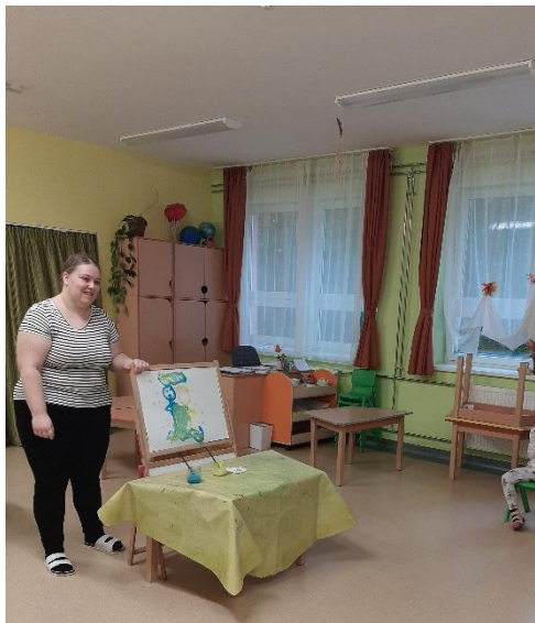
4. kép: Lázár Ervin: A Kék meg a Sárga című meséjének festéssel egybekötött mesélése

E tevékenység során már lényegesen több reakció volt megfigyelhető a gyermekcsoporton.