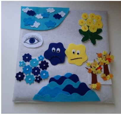
12. kép: A Mesepárna