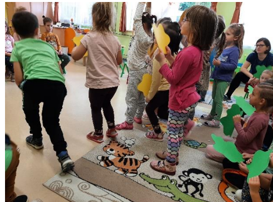
28. kép: Gyermekek a mese eljátszása közben