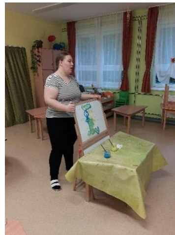
21. kép: A negyedik mesefeldolgozás, a mesemondás közbeni festés (saját kép)