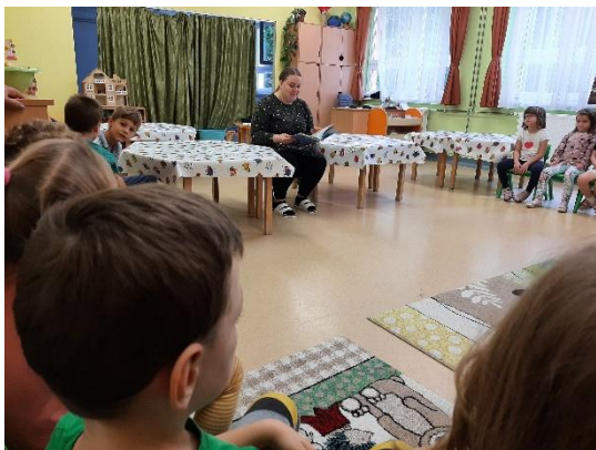
14. kép: Lázár Ervin: A Kék meg a Sárga című mesékét először hallhatják a gyermekek (saját kép)