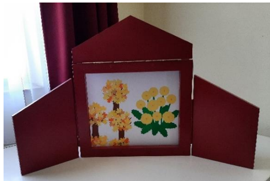
9. kép: Papírszínház 6. oldala