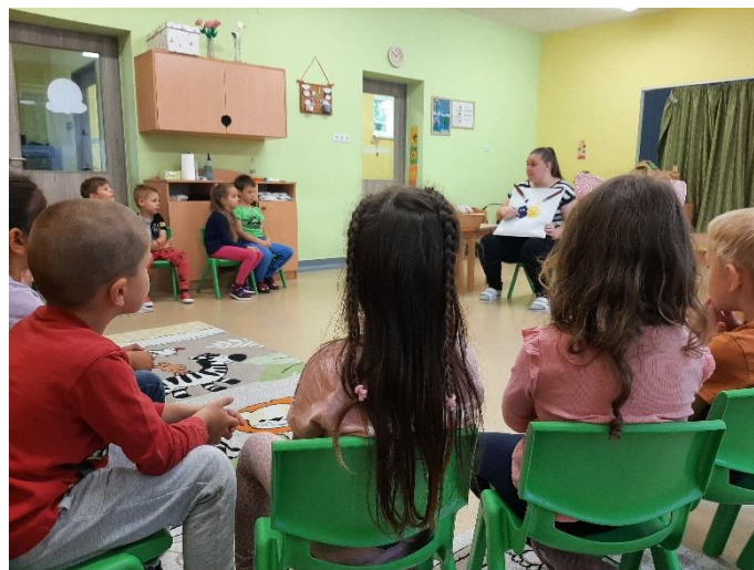
3. kép: Lázár Ervin meséjének mesepárnás feldolgozása (saját kép)

A gyermekek már a harmadik mesélés tevékenység napjának reggelén izgatottan kérdezték, hogy: Ma is fogsz mesélni? Ma is a festékes mese lesz? Pozitívumnak tekintem, hogy már várták a mesélést érdeklődtek iránta, és Lázár Ervin meséje iránt is kialakult bennük az érdeklődés.