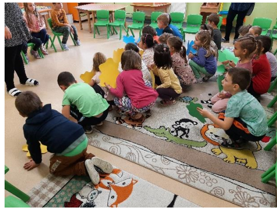
26. kép: A gyermekek elhelyezkedtek a dramatizálás kiinduló helyzetébe (saját kép)