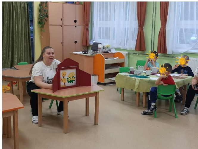
2. kép: A Kék meg a Sárga című mese papírszínházas előadása (saját kép)

Lázár Ervin meséjének papírszínházas elmeséléséhez saját magam készítettem el az oldalakat, amely a csoportba járó gyermekeknek és óvodapedagógusainknak is nagyon tetszett. A sajátos elkészítés így még egyedibbé tette a tevékenységet.