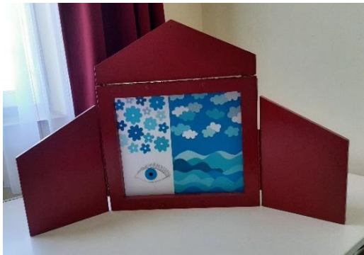
8. kép: Papírszínház 5. oldala