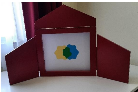
10. kép: Összemosódott festékpöttyök a Papírszínház 7. oldalán