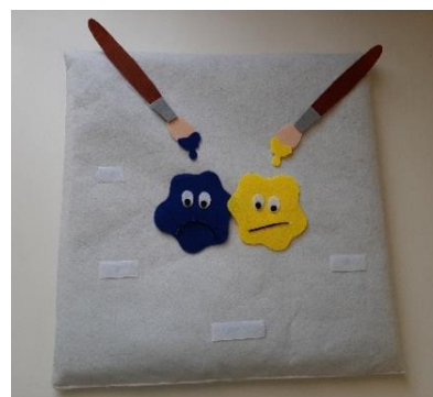
11. kép: Ecsetek és festékpöttyök a Mesepárnán