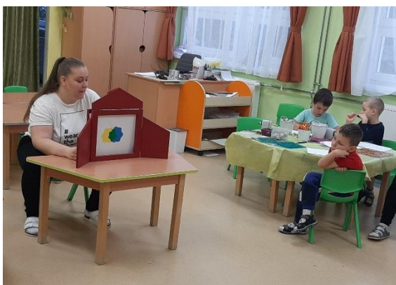
16. kép: Az asztalnál rajzoló kisfiú is a Papírszínház előadást figyeli