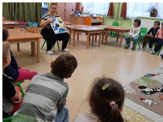
17. kép: A gyermekek a Mesepárnás mesélést figyelik (saját kép)