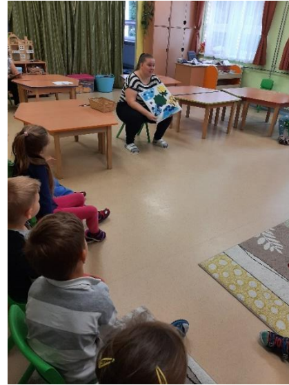
19. kép: A harmadik mesélés alkalmával minden elem felkerült a Mesepárnára