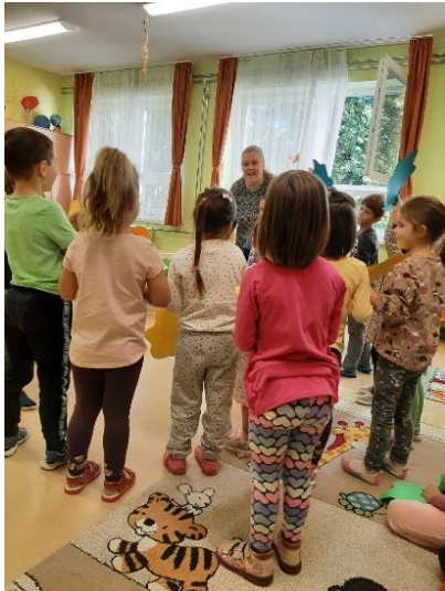
25. kép: A dramatizáláshoz történő szereposztás