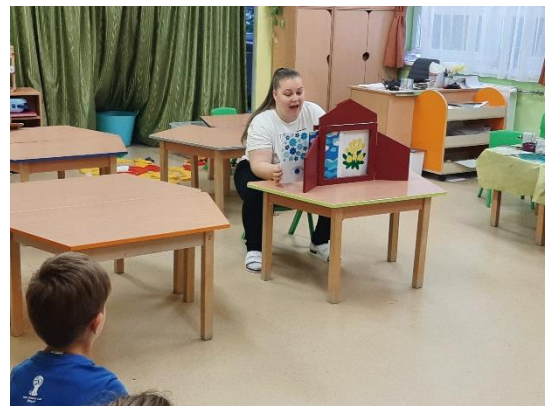
15. kép: Lapcsere a Papírszínház mesefeldolgozás során