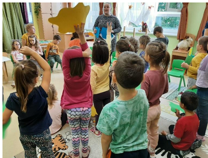
5. kép: Lázár Ervin: A Kék meg a Sárga című meséjének rájátszása

Ismertettem a gyerekekkel, hogy hogyan fogjuk eljátszani a mesét. Néhány mindig lelkes és mindenben aktív kislányon és kisfiún kívül a gyermekcsoport többsége különösebb lelkesedést, örömet nem mutatott. Közreműködők voltak, szívesen részt vettek, de az előző tevékenység sikeréből kiindulva nagyobb aktivitásra számítottam. Három csoportot alakítottunk, voltak a kékek, a sárgák és a zöldek, két félénkebb kislány nem szeretett volna részt venni a mozgásos dramatizálásban, így ők lettek a nézőközönség. A többi huszonegy gyermek eldönthette, hogy melyik szín csoportjához csatlakozik. (5.kép) Kihangsúlyoztam számukra, hogy a mese újrarájátszása alkalmával másik színeként is kipróbálhatják magukat. Lázár Ervin: A Kék meg a