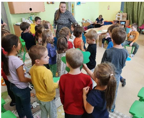
27. kép: A mese közös eljátszása