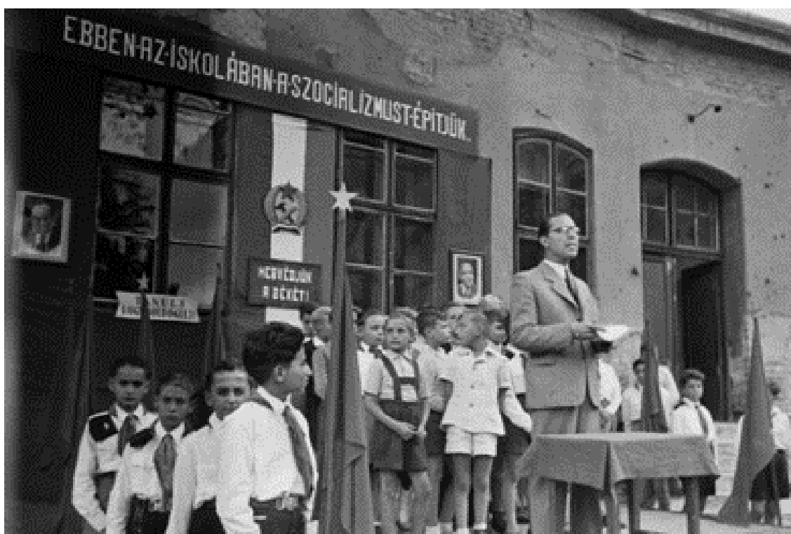
1. kép: Iskolai tanévnyitó. Budapest, XIV. kerület, Hermina út 23. szám alatti általános iskola udvara – 1949 8

munkásfiataloknak adtak otthont, hogy tanulmányaikat elvégezhessék. Megszüntették a latin kötelező oktatását, helyette bármely nyelv tanítható volt szabadon. De legtöbb intézményben nem tanítottak semmilyen idegen nyelvet, illetve csökkentették az óraszámot is. Az orosz nyelv elterjesztését tartották fontosnak, mely érdekében a tudományegyetem Orosz Intézetet hozott létre. 7