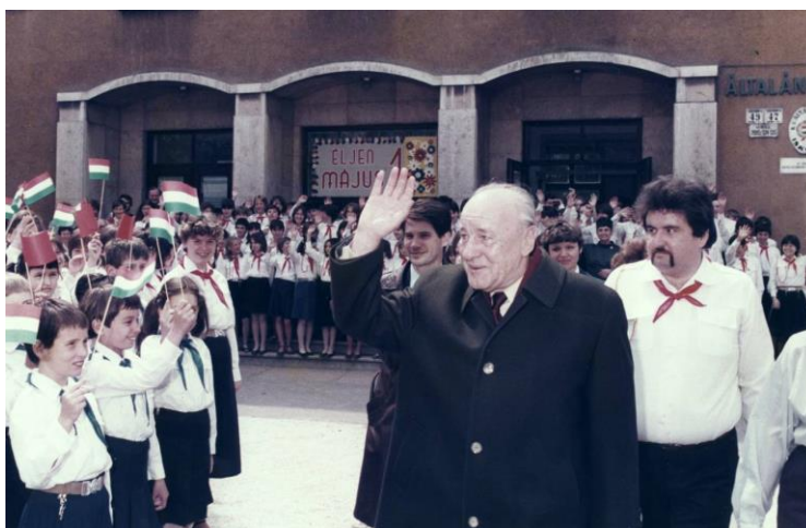
2.kép: Általános Iskola – Május 1. Ünnepe 31

A nyolcvanas években még kötelező volt az orosz nyelv tanítása és még akadt olyan tanterem, melynek falát valamelyik pártvezető portréja díszítette. De a gulyáskommunizmus vége felé már senki sem érezte azt a nagy nyomást és befolyást a pedagógusok részéről, mint ami tapasztalható volt eleinte a kezdetekor.