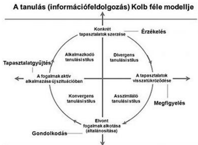
1. ábra

Kolb szerint a tanulás tapasztalat átalakulása egy interaktív folyamat révén jön létre, mégpedig négy lépcsőben (1. ábra)