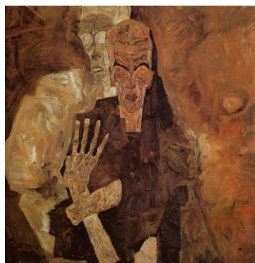
2. kép Egon Schiele: Halál és Az Ember, 1911, olaj, vászon 80x 80 cm

Egy jó példa az elmúlás megjelenítésére Edward Munch 8 művészete. Ő tipikusan az a művész volt, aki számtalanszor találkozott a halállal. Először anyja halt meg, majd nővére, végül apja is. Munch így emlékszik vissza gyerekkorára. „ A betegség, az örület és a halál angyalai vették körbe bölcsőmet, és azóta is, egész életemben követnek... Gyermekkoromban mindig úgy éreztem, hogy igazságtalanul bánnak velem, anya nélkül, betegen - és a pokolban rám váró büntetés örökké a fejem fölött lebeg. ” 9 Úgy gondolom ezek után teljesen érthető, hogy miért itatja át munkáit a halál szaga. Festményeiben mindig érezteti az elmúlás és az örület egy különös kapcsolatát. Ez érezhető az Anya Halála című képén is (1. kép), amin egy kislány kétségbe esve áll anyja halálos ágya előtt és tekint ki a nézőre. De nem ő az egyetlen festőművész, akit behálózott az enyészet gondolata.