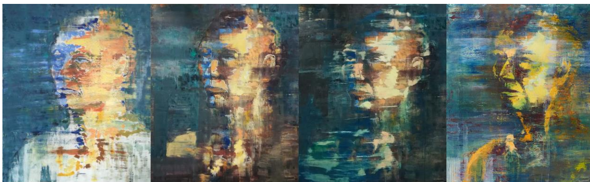
7. kép Hódosi József Tamás: Betekintés III, fázis képek , 2018; olaj, vászon 140x 180 cm

számomra, mert nem volt segítségemre sem kép, sem vázlat a végleges állapot elérésének megállapításához. Így mindegyik kép addig készülhetett, amíg úgy nem éreztem, hogy már nem tudok mit csinálni rajta, anélkül hogy el ne rontsam. Azt az állapotot kerestem, ami kellemes a szememnek. Ugyanakkor azonban, később arra a megállapításra jutottam, hogy a keresett állapot számomra elérhetetlen, mert maximum pár napig tetszik, amit látok, majd ismét megváltoztatnám.