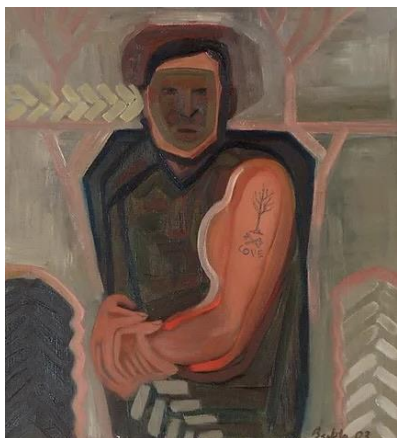
6. kép Bukta Imre: Traktoros, 2003; olaj, vászon

külföldön is. Dolgozott temérdek művésztelepen is többek közt Zalaegerszegen és Csongrádon is.