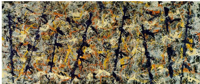
4. kép Jackson Pollock: Kék oszlopok , 1952; zománc, vászon 212,1x 488,2 cm

Az absztrakt expresszionizmus technikái közé tartozott az ún. csurgatásos technika is, ekkor a festéket rácsorgatták a hordozóra és a kompozíció kialakulásában a véletlenszerűség is dominált. Mivel ilyenkor nagyjából meghatározott a festéknek az érkezési helye és a kép az ember által alakul ezért ellenőrzött