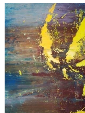
8. kép Hódosi József Tamás: Betekintés III, részlet , 2018; olaj, vászon 140x 180 cm

számomra, mert nem volt segítségemre sem kép, sem vázlat a végleges állapot elérésének megállapításához. Így mindegyik kép addig készülhetett, amíg úgy nem éreztem, hogy már nem tudok mit csinálni rajta, anélkül hogy el ne rontsam. Azt az állapotot kerestem, ami kellemes a szememnek. Ugyanakkor azonban, később arra a megállapításra jutottam, hogy a keresett állapot számomra elérhetetlen, mert maximum pár napig tetszik, amit látok, majd ismét megváltoztatnám.