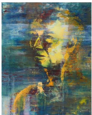
11. kép Hódosi József Tamás: Betekintés III , 2018; olaj, vászon 140x 180cm

A sorozatot keretes szerkezetbe foglaltam. Így fejezem ki a karmának az életre gyakorolt hatását, ami bennem egy körkörös mozgás jelenlétét kelti. 37