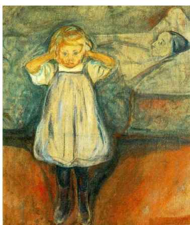
1. kép Edward Munch: Anya Halála, 1899-1900; olaj, vászon. 99x 90 cm

Ahogy az ideológiákban, vallásokban szerepet játszik a halál, épp úgy a művészetben is évszázadok óta jelen van. Számos művészeti produktumban megjelenik a vég, ami sok művészt foglalkoztat már több száz év óta. Az ismeretlen megismerése utáni vágy is szerepet játszik ebben, de sok esetben elhunyt szülők, rokonok hiánya vagy sűrű betegeskedés is szükségessé teszi.