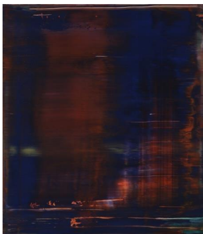
5. kép Gerhard Richter: Abstraktes Bild , Catalogue Raisonné 843-8, 1997; Oil on Alu Dibond 55x 48 cm

Művészetét erőteljesen befolyásolta a fiatalkora. Fiatalon megélte Hitler uralmát, majd a második világháborút és a szocialista rendszert. Ebből eredeztethető, hogy soha nem határolódott el egy stílus és ideológia mellett sem. Feltételezhetően elege lett ezekből.