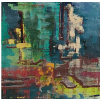
9. kép Hódosi József Tamás: Betekintés I , 2018; olaj, vászon 100x 100cm