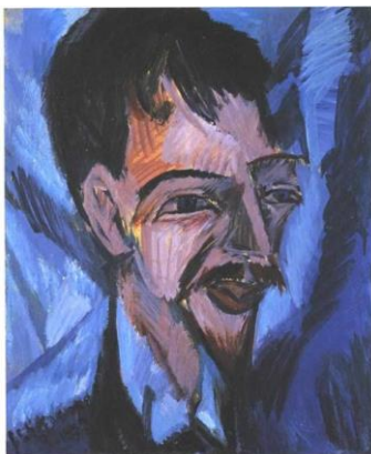
3. kép Ernst Ludwig Kirchner: Portré Alfred Döblinről, 1912; olaj, vászon 50,8x 41,3 cm

Az expresszionizmus a 20. század elejéről eredeztethető avantgárd irányzat. Jelen volt Közép, Észak és Kelet-Európában is, de később az egész világ festészetére hatással volt. Egyik legjelentősebb vonala a Német expresszionizmus volt. Sajátossága abban jelentkezik, hogy nem kiáltvánnyal kezdődött, hanem egy csoport jött létre, akiket nem a művészeti stílusuk vagy látásmódjuk kötött össze, hanem az élethez való hozzáállásuk. Ilyen volt a Der Blaue Reiter és a Die Brücke csoport, amiknek tagja volt a 3. képen látható festménynek megalkotója Ernst Ludwig Kirchner is.