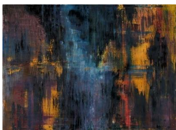
10. kép Hódosi József Tamás: Betekintés II , 2018; olaj, vászon 100x 140cm