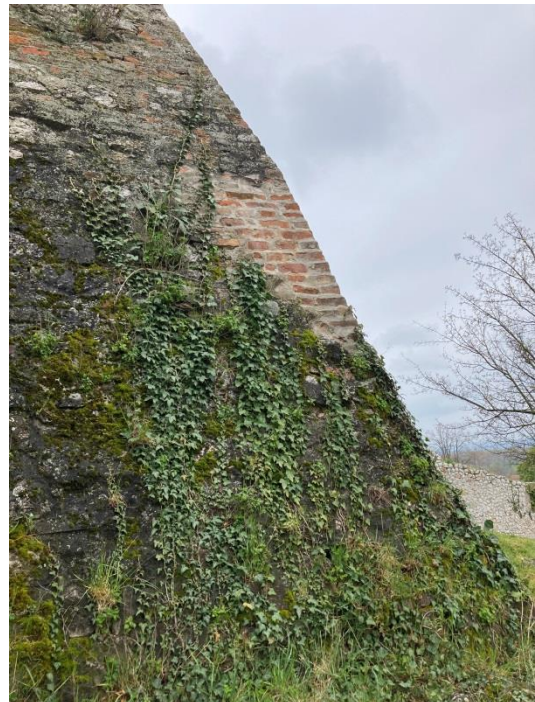
13. kép: Összefoglaló egy képen

Első körben fontosnak tartom rendezni, hogy ennek lebonyolítása a vár tulajdonosának, az üzemben tartójának vagy a működtetőjének a felelőssége. A történeti áttekintésben is jól megfigyelhető, hogy a folyamatos állagmegóvás minden időkből tervszerűséget és átgondoltságot követelt meg, annak hiánya pedig súlyosan leromlott állapothoz vezetett, aminek a rendbe hozása nagy volumenű felújításokat és forrásokat igényelt. A saját magam által elvégzett munka eredményeként kijelenthetem, hogy a falak növényzetmentesítése csak ipari alpinista technikával látható el szakszerűen és biztonságosan, továbbá az ivóvíz bázis védelme érdekében tilos bármilyen jellegű kémiai gyomirtó használata. A növényzet eltávolítása egy folyton megújuló feladat, a fal jelenlegi néhol kritikus állapota miatt a növények könnyebben kapaszkodnak a foghíjas területekbe így gyakrabban, azonban a falak kijavítása után elég lenne évente egyszer elvégezni azt. A vár