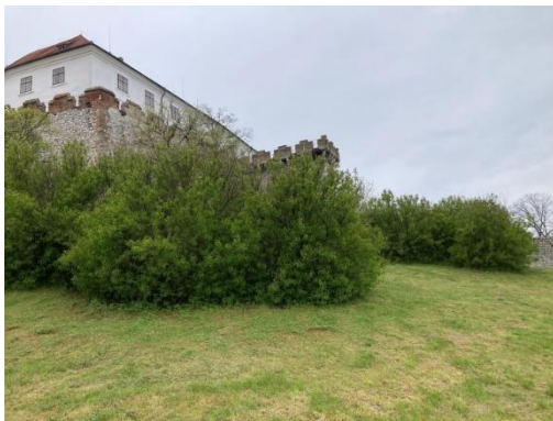
8. kép: Saját fotó a várkertről 2.

vesszük alapul a kultúrtörténeti emlékek valódi értéke nem a hasznosításukban, vagy a funkciójukban, hanem sokkal inkább a nemzeti összetartozásunkban, tágabb értelemben az emberi kreativitás a technológiától független alkotási képesség és az emberiség végtelen évezredek átívelő találékonyságának örök mementói, amelyek emlékeztetnek bennünket, hogy történelmünk nem csak baljós vérzivataros események sorozata, hanem egyben egy hosszú napjainkban is zajló sikertörténet különböző epizódjai. A várat, mint épített örökséget természetesen nem csak, mint épületegyüttest, hanem természeti környezetével együtt illeti meg a védelem. Hogy Kaán Károlyt idézzem: „A műemlékek természeti díszei ezért a maguk helyén védelmet igényelnek és követelnek meg. Ugyanilyen értelemben szorgos gondozásunkra szorulnak a várromok és egyéb történelmi emlékek természeti díszei is. Ahol pedig hiányzanak az ilyen természeti díszek, az a kötelességünk, hogy azokat hozzáértéssel és mielőbb pótolni