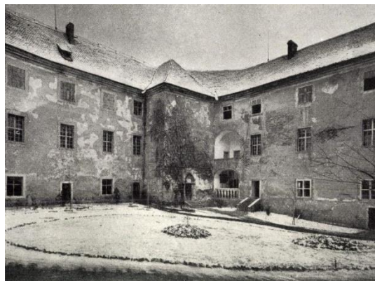
14. kép: A vár akkoriban

Ez a mértékű szakmaiság sajnos alábbhagyott és inkább a design került előtérbe, az autentikusság helyett. Gondolok itt a várakban megjelenő modern acél és üveg szerkezetekre, látogató központokra. A kérdést közelebbről, egy másik szemüvegen át megvizsgálva elmondhatjuk, hogy a 2011 végével befejeződő nagy volumenű felújítást még 2014-2015-ben követte egy átfogóbb munkálat, amelyben az északi szárny fogadó termét alakították ki, befejezték az északi homlokzat átalakítását, továbbá vizes blokkokat, kamera rendszert és fűtést telepítettek. Ebben a felújítási periódusban zajlottak a fal kutatások is, amikor igen értékes relikviákra bukkantak, azonban a külső várfalak állagmegóvása nem került