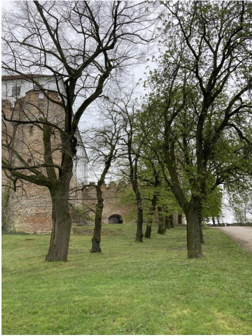
7. kép: Saját fotó a várkertről