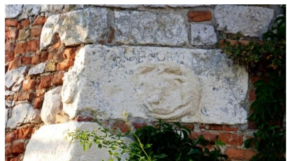
2. kép: A címer körüli felirat napjainkban

A Garaiak hatalma és pénzügyi lehetőségei által a regnálásuk alatt a vár teljesen átépült. A Siklósiak várát valószínűleg teljesen elbontották és a régi épület helyét egy háromemeletes palotaszárnyból álló U alaprajzú épületegyüttes váltotta fel, amelyet kökeretes ajtók tagoltak, ülőfülkés ablakok és díszes párkányok ékesítettek. További nagyon értékes emlék a vár Garai korszakából, a török dúlás elől elrejtett, majd a 2013-2014-es feltárás során felfedezett Krisztus relief. „Siklóson, a várkápolnában, mélyen a vakolat alatt a művészettörténész Bartos György gótikus kőreliefet talált, amely a Fájdalmak férfiét (Vir dolorum) ábrázolja; a „prófétai látomást” a vérző Krisztusról, a tűnő-múló idő örök szépségét, amely az élet centrumában Isten alázatát és szenvedését idézi koronként, a harmóniát, amelyről Szent Ágoston elmélkedik.” [5] Továbbá kibővült a vár egy kapuvédő barbakánnal, illetve egy külső tornyos véd rendszerrel. A vár e korszak-béli korszerűségét és felszereltségét is jól tükrözi, hogy Hunyadi János 1440-ben képtelen volt elfoglalni és végül feladta az ostromot. A főúri udvartartás illetve a Bencés apátság miatt kiépült a