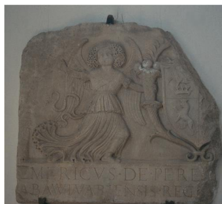
3. kép: A Perényi címer töredék táblája

Fontos és értékes lelet még ebből a korszakból Perényi címer töredék táblája. 1932-ben fedezték fel a siklósi katolikus templom és az egykori kolostor összekötő folyosójának padlózatában az ábrázolással lefele. A táblának a bal fele maradt meg, 15 cm vastag, a közepén címerpajzs, a férfi fejjel, az épen maradt oldalán pedig a névjelző felirat, illetve egy angyalábrázolás, mely bal kezében egy bőségszarut tart, belőle kilógó pálma ággal. A névjelző felirat: „Emericus de Perényi Comes