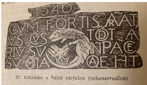
1. kép: A címer körüli felirat 1963-as kiadványban

Zsigmond király 1387-ben hűtlenség vádjával elkobozta az erődítményt a Siklósiaktól, és Kakas László illetve Pásztói János kapták meg, mint királyi adományt, azonban az erősség birtoklása kérészerű volt számukra, mivel a várat Garai Miklós, aki korának egyik leghatalmasabb főura, 1395-ben örök adományul nyerte el. 1401-től közel fél éven át, amikor a nemesek fellázkodtak ellene, Zsigmond király is ebben a várban töltötte a tisztes őrízését. Miután Zsigmond újra megszilárdította hatalmát, 1402-től ifjabbik Garai Miklóst nádorrá nevezte ki és mivel a család székhelye Siklós volt, így a város megkapta a nádor városa (Civitas Palatinalis) címet. 1408. december 12-én Zsigmond király megalapította a Sárkányos Társaságot (Societas Draconistrarum), melynek címer töredéke a mai napig megtalálható a Perényi Bástya egyik sarokkövéként. „A címer körül a felirat: Cum fortis armatus custodit atrium suum in pace, sunt omnia, quae habet ” [4]