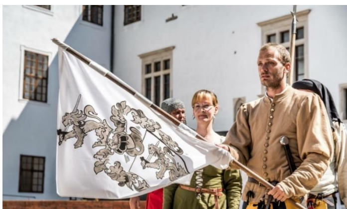
11. kép: Hagyományörzőként a Siklósi Várban