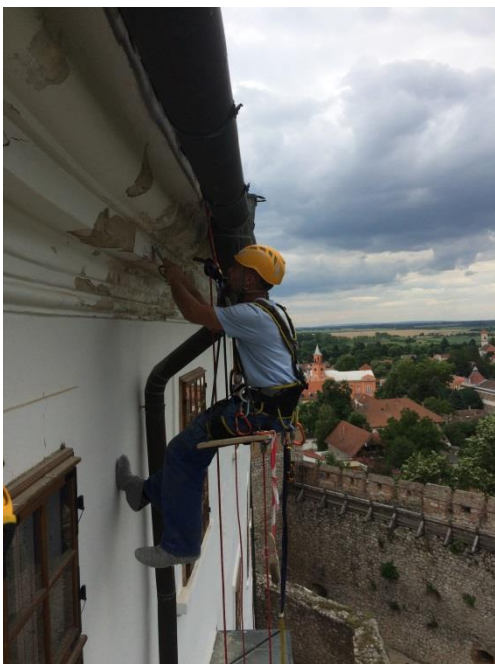
9. kép: Várfalon végzett munka ipari alpinistaként

A siklói várban végzett munkásságom, amelyek az épített örökség védelmét szolgálják, két részre oszthatók. Az első a tényleges állagmegóvási műveletek, amelyeket a falakon végeztem, a második a hagyományörző programokon való aktív részvétel, amely mint turista attrakció, jelentős bevételeket generált a vár számára.