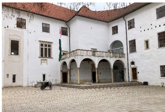
15. kép: Napjainkban