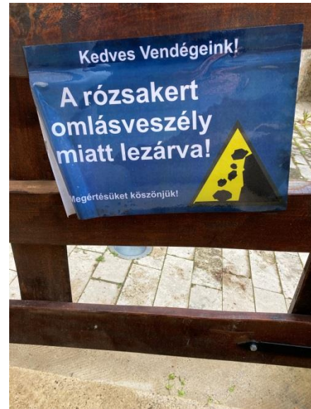
16. kép: Jelen állapot

terítékre. Az északi és a keleti várfalon zajlott egy két foltozás illetve négy különösen rossz állapotú pártázat helyre állítása. Ezeknek tükrében elmondható, hogy bár zajlott egy felújítási periódus, az állagmegóvás apróbb, de folyamatos jellegű munka volt. Zár javítások, egy-egy kihullott kő visszafalazása illetve a várkert gondozása. Ezek a munkák nem tervszerűen zajlottak, sokkal inkább ahol a fal veszélyessé vált vagy más miatt megjelenő akut probléma elhárításáról szóltak. Az épület állagmegóvása és a kulturális élet fellendítése között mindkét interjú alanyom látott kapcsolatot. Ezt a kérdést is két részre lehet bontani. Az első irány, a környék turisztikai versenyképességének a növelése.