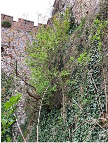
12. kép: A várfal jelenlegi állapota

A Dél- Keleti falon szinte egy önálló gyomtársulás található. A kihullott, hiányzó kövek helyén szépen gyökeret vertek a cserjék. Megtalálható a Fekete bodza ( Sambucus nigra ), a Közönséges vadszőlő ( Parthenocissus vitacea ), a Hamvas zsombor ( Sysimbrium orientale ), a molyhos ökörfark kóró. Egy másik falszakaszon a várkertben, valószínűleg dísznövénynek ültetett Bugás csörgőfa ( Koelreuteria paniculata ) eresztett gyökeret, de jelen van még a várfalon a Mirigyes bálványfa ( Alantus altissima ) és a Molyhos ökörfarkkóró ( Verbascum thapsus ) is. A felmérésem alatt védett növényt nem találtam. A falból látható darabok