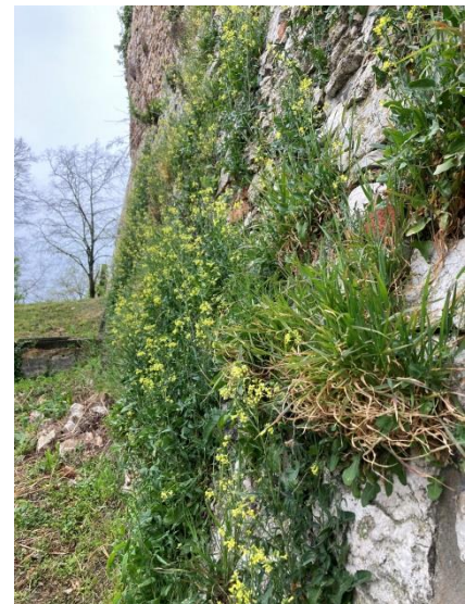
13. kép: A várfal jelenlegi állapota 2.

hiányoznak. A külső várfal bástyáit a hatvanas években felújították, gerendázatot és tetőt kaptak. Ebből a felújításból már csak a Gyüdi torony acélgerendái maradtak meg, mert a tetőszerkezetek tartógerendái elkorhadtak, így a város vezetése a balesetveszély miatt kénytelen volt ezeket eltávolítani. A szomorú kérdés, hogy most a tető nélkül ázó falak vajon meddig fogják bírni az idő vas fogát. A 2021-ben átadott felújított várkert ugyan adott a városnak egy kávézót, egy új sétányt illetve egy játszóteret azonban a külső falak felújítása még várat magára. Egy két kritikus ponton itt-ott látszik a javítás, de ezek jobbára csak kárcsökkentő munkálatok, semmilyen preventív munkának nincs nyoma. A Barbakán gyilokjárójának több mint a felét le kellett zárni, szintén a fa talapzat elkorhadása miatt. Ezt a faanyag védelmének hiánya, vagy nem megfelelő védelme okozhatta. A Kanizsai Dorottya kert omlásveszély miatt el van zárva a turisták elől, mert a borostyán annyira kikezdte a falszakasz felső részét, hogy bármikor kövek zuhanhatnak az alatta elterülő sétányra. A kápolna mögötti védmű 2018-ban még teljesen körbejárható volt