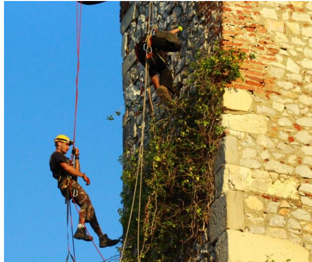
10. kép: Várfalon végzett munka ipari alpinistaként 2.

ázhasson le újra, illetve a környékbeli tetőcserepeket megigazítottuk. A várfal legnagyobb ellensége a rajta felnövő növényzet. Mind a borostyán, mind a vadszőlő, ahogy kapaszkodik rajta, úgy egyre inkább bontja meg a sziklák közötti kötőanyagot, ahova aztán víz kerül, ami minden télen a fagyás miatti térfogat növekedés eredményeképp feszíti szét a falakat és mélyíti a repedéseket. Felmerülhetne ötletnek az olvasóban, hogy miért nem oldja meg a vár kezelője gyomirtóval a problémát? Ahogy fentebb írtam a siklói ivóvízbázis a mai napig a vár alatti karsztvíz, ennek kitermelésére a még török időkben fűrt kutat használják, némileg kiszélesítve. Ez a tény egy nagyon szigorú szabályozást von maga után, így a várban tiltott a peszticidek