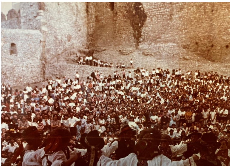
6. kép: Siklósi várfesztivál, 1966

Az 1963-ban forgatott, majd 1964-ben megjelent A Tenkes Kapitánya című történelmi kalandfilm sorozat a Siklósi várban és a Villányi hegységben játszódik, amely tovább emeli az épület ázsioját a turisták számára. Hamarosan megnyílt az első kávézó a vár teraszán, majd a vár pincéjében az étterem is. Mind a kettő mind a helyiek, mind a turisták számára igen közkedvelt szórakozóhellyé vált. Ahogy ez a korabeli újságcikk is erről számol be: „Szállodája, turistaszállása az év nagyobb részében teli van vendégekkel. A konferencia termében egymást érik a kongresszusok, tanácskozások: ENSZ, KGST, UNESCO, a kisebb jelentőségűeket már meg sem említve. A vár vaskos vendégekönyveiben bejegyzések: államférfiak, művészek, sportolók. Alig van olyan diplomáciai képviselő Magyarországon, amelynek tagjai ne látogattak volna el ide.” [13]