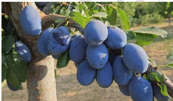
3.ábra. Stanley szilvafa érett termése. (Antal, 2022)

A Stanley fajta augusztus végén – szeptember elején, míg a Stuttgart szeptember második felében érik. Az érett gyümölcs kékeslila színű, hamvas bevonattal, magas cukortartalommal és csökkenő savtartalommal rendelkezik, ami meghatározza élvezeti értékét. Az optimális szüretidő betartása kulcsfontosságú a gyümölcs minősége, tárolhatósága és szállíthatósága szempontjából (Benedek, 2000). A Stanley gyümölcse ipari feldolgozásra is alkalmas, míg a Stuttgart aromásabb, nagyobb termése a frisspiaci értékesítésben keresett.