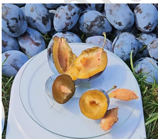
10.ábra. Stanley szilva húsa és magva (Antal, 2023)

A Mag-hús arány vizsgálati eredményei alapján a Stanley szilva tömegének 6,1%-át és a Stuttgart szilva tömegének 6,8%-át teszi ki a mag. A Stuttgart gyümölcsei kicsit nagyobb magtartalommal rendelkeznek, ami befolyásolhatja a hús élvezeti értékét, de a magasabb cukortartalom és ízintenzitás ellensúlyozza ezt. Mindkét fajta kedvező hús-mag arányú, de a Stuttgart szilva gyümölcse kissé tömörebb.