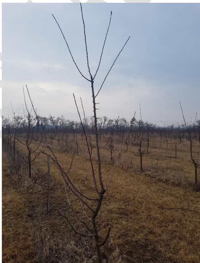
5. ábra. Metszési fázis a vizsgált ültetvényben. (Antal, 2023)

A fiatal fák koronaalakítása az ültetést követő első 3–4 évben történik. A Stanley és Stuttgart fajták esetében a hagyományos sudárvázis koronaforma mellett intenzív ültetvényekben a karcsú orsó koronaforma is alkalmazható (Soltész, 2008). A szilva gyümölcsének vízigénye nagy, ezért aszályos években az öntözés kiemelten fontos, leginkább csepegtető rendszer alkalmazásával. A tápanyag-utánpótlást talajvizsgálatra alapozva kell végezni, kiemelt figyelmet fordítva a kálium pótlására, amely jelentősen befolyásolja a termés minőségét és eltarthatóságát (Papp, 2010).