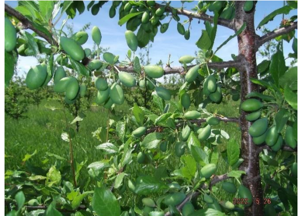
2.ábra. Stanley szilva gyümölcsfejlődési folyamata. (Antal, 2022)