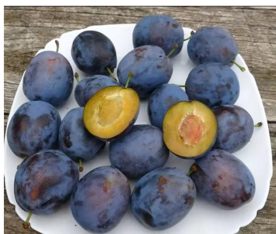
11.ábra. Stuttgart szilva húsa és magva (Antal, 2023)