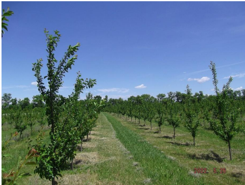
7.ábra. A vizsgált ültetvény. (Antal, 2023)