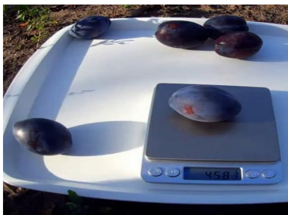
8. ábra. Stanley szilva tömege, mérete, formája. (Antal, 2023)