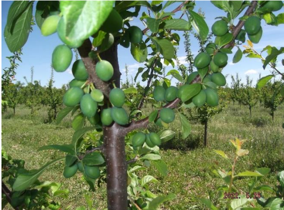
1.ábra. Stuttgart szilva gyümölcsfejlődési folyamata. (Antal, 2022)

A természetes gyümölcszuhlás a fák önszabályozó mechanizmusa, de mesterséges ritkítással a gyümölcsök mérete és minősége javítható.