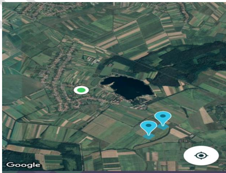
6.ábra. Az ültetvény elhelyezkedése Beregdédán.

Az uralkodó szélirány északi. Az éghajlat mérsékelt, az éves középhőmérséklet +9,5 °C, a legmelegebb hónap a július ( 18 – 20 °C), míg a leghidegebb a január ( -3 – 4 °C). Tavasszal gyakoriak a kései fagyok, az ősz pedig rendszerint meleg, száraz és napos. Az éves csapadék mennyisége átlagosan 650 – 700 mm, a vegetációs időszakban 400 – 450 mm, amely egyenlőtlenül oszlik el. A vegetációs hőösszeg 3000 °C, a napfényes órák száma pedig kb. 2000 , ami a termesztetőséget a régió északi határára helyezi (Izsák, 2007).