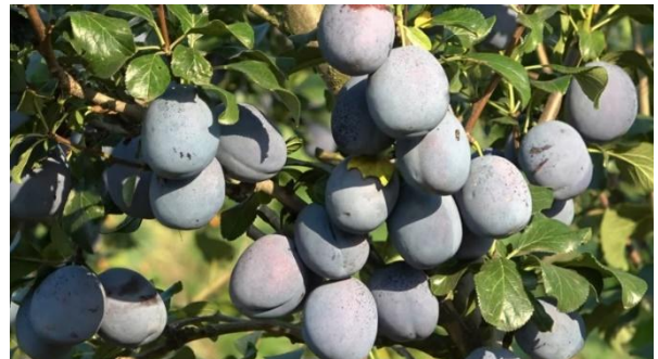
4.ábra. Stuttgart szilvafa érett termése. (Antal, 2022)