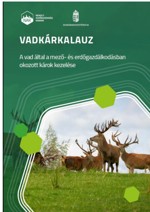
1. ábra: „Vadkárkalauz” című kiadvány borítóképe

vadászatra jogosultak szakszemélyzetétől is, jelezve annak hiánypótló jellegét. A kiadvány „jól fogy” több vármegyében már elfogyott. A kiadvány egyik célja az volt, hogy a NAK elérhesse azon tagjait is, akik korukból vagy jártasságukból adódóan nem tájékozódnak az online térben, de mint aktív gazdálkodóknak szükségük van a legfontosabb információkra.