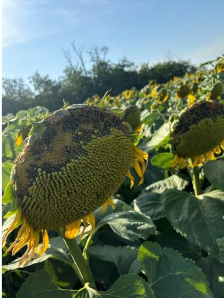
5. ábra: Vetési varjú által okozott kár