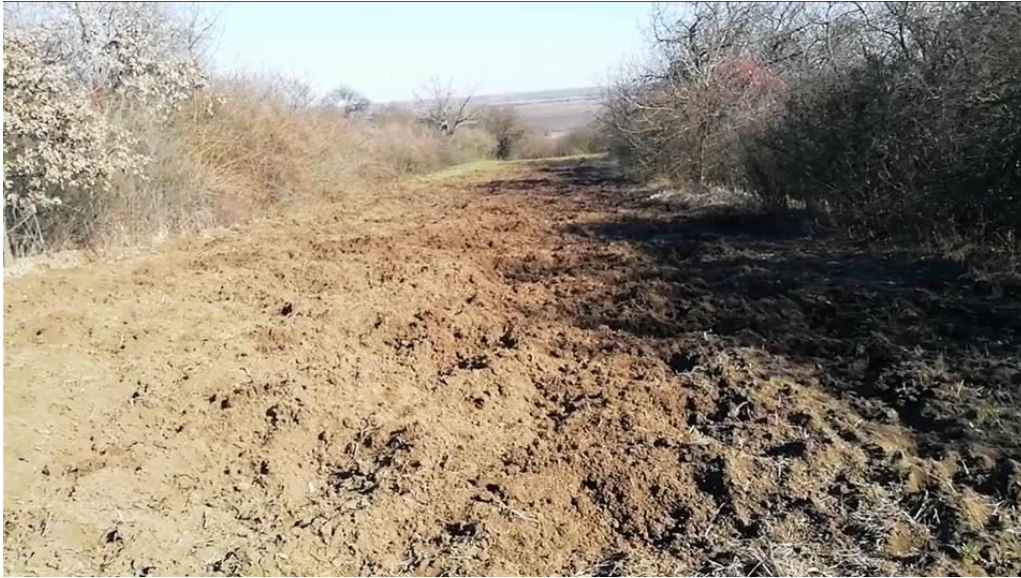
6. ábra: Belterületi vadkár (vadkárkezelési eljárás előtt)