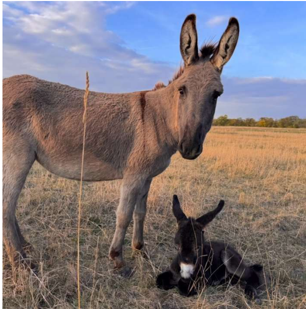
4. ábra-magyar parlagi szamár és kicsinye

tartásmóddal és takarmánnyal szembeni igénytelensége (Nemzeti Biodiverzitás és Génmegőrzési Központ).