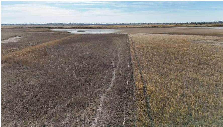
7. ábra- nád visszaszorítása legeltetéssel

Összességében ~78%-kal csökkent a nád borítása a legelt mintaterületeken a vizsgált 3 hónap alatt, ha a kvadrátokban a hiányt 0%-nak vesszük és a három zónát (szikfok, padkaoldal, padkatető) egyenlően súlyozzuk. A nemlegelt állományrészek magasabb nád-borítást mutatnak, és a nád gyakrabban fordul elő teljes kvadrátsoron, mint a legelt részeken. A különbség a szikfokon a legmarkánsabb (-87,6%-os csökkenés), de a padkaoldalon és a padkatetőn is kimutatható a változás.