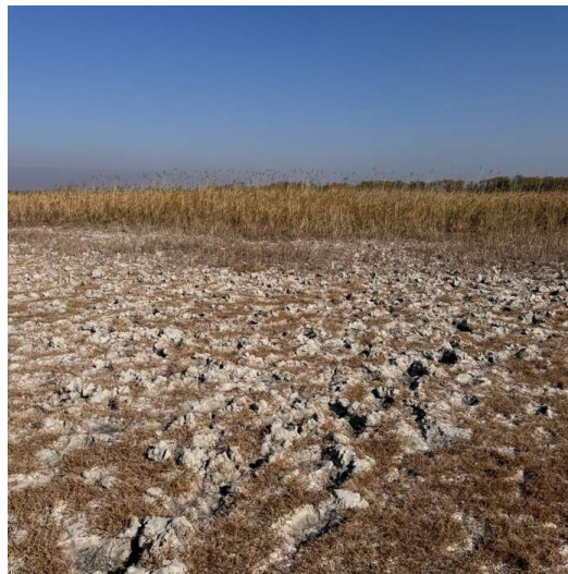
2. ábra-Szarvasmarha legeltetés nyomai a szikes tómederben.

A szarvasmarhák eredménnyel legeltethetők a szikes gyepeken és további vizes élőhelyeken. Nemcsak a gyepnövényzet elfogyasztásával, hanem a testtömegükből adódó taposással is hozzájárulnak a mozaikos felszínformák kialakulásához. A nyári időszakban, amikor a vizes, náddal borított élőhelyek kiszáradnak, szívesen fogyasztják a zsenge nádhajtásokat és a zombékos foltok növényzetét (Ecsedi et al. 2004). A tavaszi kihajtás során a szikes medrek még vízborítás alatt állhatnak, ilyenkor az állatok taposása mély nyomokat hagyhat a vakszik felületén, amit a terület hosszú ideig megőriz (2. ábra) (ÁNÉR, Molnár és Bagi 2011).