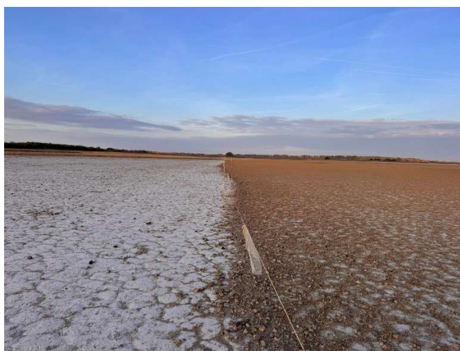
6. ábra Vaksziken a villanypásztor két oldala