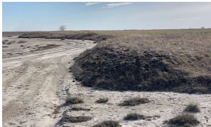
1. ábra-löszös szikpadka a Mikla-pusztában

A szikes pusztákból kiemelkedő akár 30-100 cm magas szikpadkák (1. ábra) (Mikla-puszta, Rakonczai és Kovács 2006, Rakonczai és Kovács 2000) jellemzően löszösek (6250* élőhely). A löszgyepek növényzetét az Általános Nemzeti Élőhely-osztályozási Rendszer alapján mutatom be. A padkák talaja humuszban gazdagabb, a felszíne rendszerint zárt szárazgyep, de a növényzet összetétele jelentősen függ a hasznosítás intenzitásától. A legeltetés megszűnésével a löszgyepek gyorsan avarosodni kezdenek. Leggyakrabban felfedezhető fűfajaik közé tartozik a pusztai csenkesz ( Festuca rupicola ), a sókedvelő sziki csenkesz ( Festuca pseudovina ) (Soó 1980), deres tarackbúza ( Elymus hispidus ), közönséges tarackbúza ( Elymus repens ), karcús fényperje ( Koeleria cristata ), taréjos búzafű ( Agropyron pectinatum ) (Bodrogyközy 1980). Ritkábban előfordul kunkorgó árvalányhaj ( Stipa capillata ), élesmosófű ( Chrysopogon gryllus ) és fenyérfű ( Bothriochloa ischaemum ), melyek főként a Dunai-síkon jellemzőek.