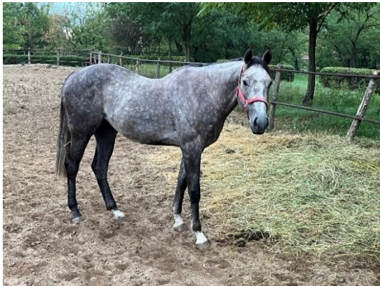
1. ábra: Tofightforlove (IRE)