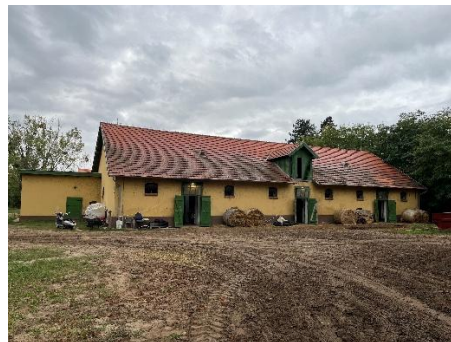
15. ábra: Ribárszki Sándor istállója