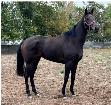
3. ábra: Ipswich Dodó