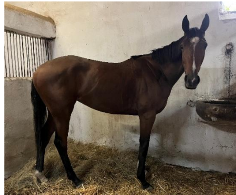
2. ábra: Lady Goldy (IRE)