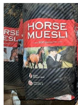
30. ábra: Horse Muesli

Az első a Foran Chevinál terméke, mely egy kimondottan komplex folyadék. Gazdag ásványi anyagokban, vitaminokban, aminosavakban és energiában, mely kimondottan alkalmas verseny- és munkalovak takarmányozásának kiegészítésében való alkalmazásban. Hatásai között felsorolható, hogy támogatja a szervezet regenerációját, ezáltal az immunrendszert is erősíti, pozitívan befolyásolja az étvágyat. Folyékony kiszerelésének köszönhetően könnyen mérhető, adagolható az abrakolás során. Az adagolási útmutató szerint esetünkben a 330-450 kg közötti tartományon belül a nehéz munkát végző adagot kell nézni, ami naponta 50 ml mennyiséget jelent. Beltartalmi értékei 50 ml mennyiségre vetítve: Nyersfehérje 2,3 g, Nyerszsír 0,8 g, Nyersrost 0,2 g, Nyershamu 6,05 g. A-vitamin: 30,000 IU, D3-vitamin: 4,500 IU, E-vitamin: 850 mg, K-vitamin: 5 mg, B-vitamin komplex: B1 (50 mg), B2(20mg), B6(20mg), B12(80mg), folsav(25mg), biotin(100mg). Nyomelemek: Vas: 80 mg, Réz: 70 mg Cink: 250 mg, Mangán: 200 mg, Jód: 1mg, kobalt 1mg, szelén 0,35. Aminosavak: DL-metionin: 400 mg, L-lizin: 500 mg