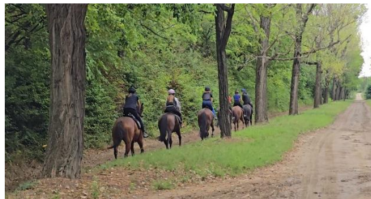
18. ábra: Bemelegítés a pályára vezető úton