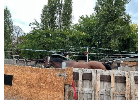
13. ábra: Jártatógép használat közben