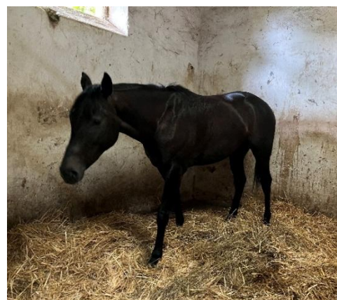
4. ábra: Loss Alamos