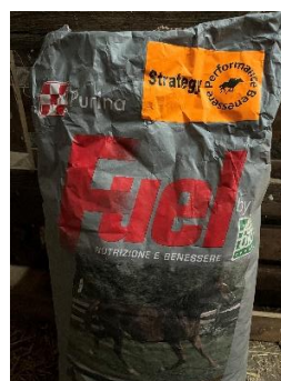
29. ábra: Purina Fuel Strategy SL