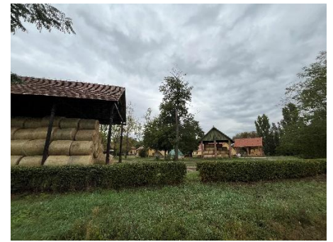
16. ábra: Széna- és szalmatárolók