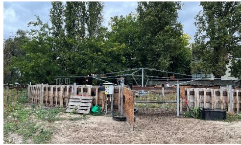
12. ábra: Jártatógép