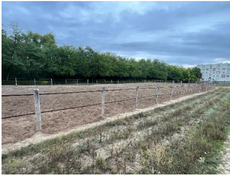
11. ábra: Karám