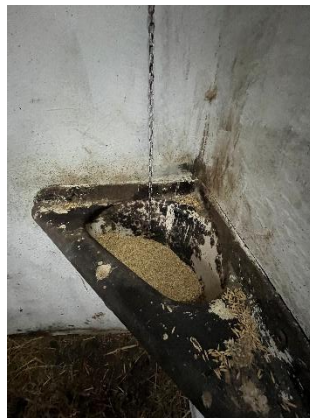
9. ábra: Boksban lévő etető