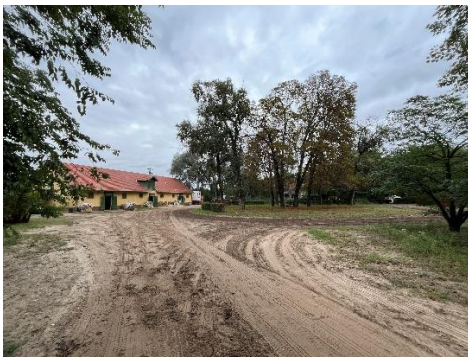
14. ábra: Istálló és a felvezető (saját felvétel)