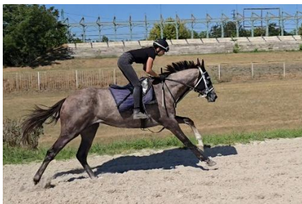
17. ábra: Galopp tréning