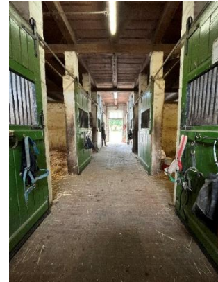
7. ábra: Istálló folyosó (2)