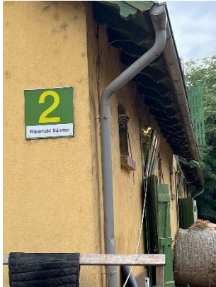
5. ábra: Ribárszki Sándor istállója