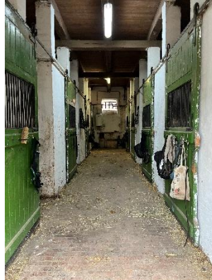
6. ábra: Istálló folyosó (1)