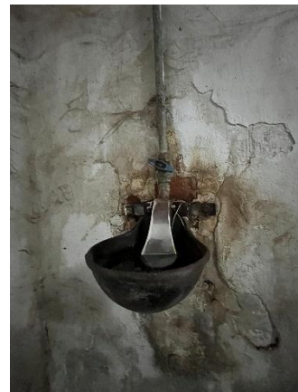
10. ábra: Boksban lévő önitató (saját felvétel)

Fontos az elején kiemelni, hogy mivel ezek a lovak nagy teljesítmény nyújtanak, tehát nagy igénybevételnek vannak kitéve, ehhez megfelelő mennyiségű és minőségű takarmányra, energiára van szükségük. Az egyes ásványi anyagok, vitaminok és egyéb anyagok pótlására bizonyos takarmány kiegészítőket etetnek. A nagy teljesítményű lovak esetében testtömegük 3%-át fel kell venniük abrakból. Ez ebben az esetben, 400 kg átlag súlyra kalkulálva nagyjából 12 kg-ra tehető.