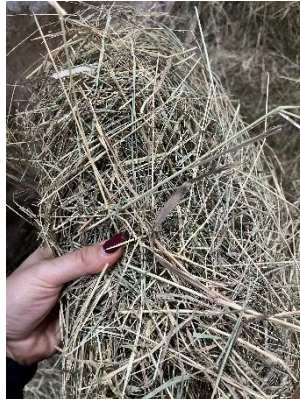
21. ábra: Réti fűszéna