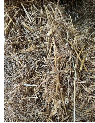
22. ábra: Zabszalma

A kiegészítők a következők szerint alakulnak a mennyiségekkel együtt: Chevinal 50 ml, Protein-Mineral-Pellets 8dkg, Equi-Salts 3 dkg, Red Mills 20% Red Mills Oat Balancer Cooked Mix 1 kg, Horse Strategy_SL 1kg, NRG XPRO Immuny 1kg, Horse Muesli 1 kg.