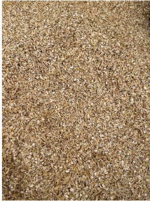
20. ábra: Roppantott zab

Visszaérve az istállóokhoz a pályáról, egy óra magasságában megkapják a második abrak adagjukat. Ez megközelítőleg 1 kg zabból és kiegészítőkből tevődik össze.