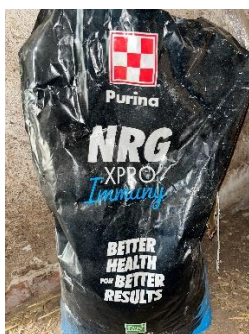
27. ábra: Purina NRG XPRO Immunity