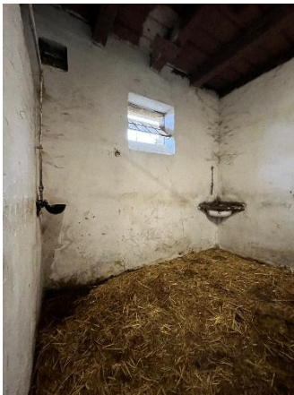
8. ábra: Boks