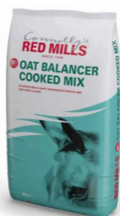
28. ábra: Red Mills Oat Balancer Cooked Mix