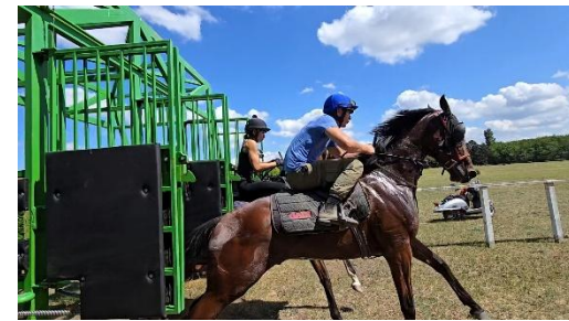
19. ábra: Start kapuhoz szoktatás

Alagon három különböző méretű és talajú pálya áll rendelkezésre. Az egyik egy 2700 m hosszú, szintetikus talajjal telepített pálya, melyet nyári pályának neveznek. Továbbá van egy 1600 méteres is, mely szintén ezzel az anyaggal borított. Valamint egy gyepes pálya, ami 2800 méter.