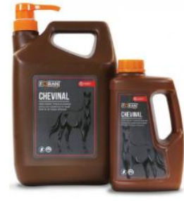
26. ábra: Chevinal