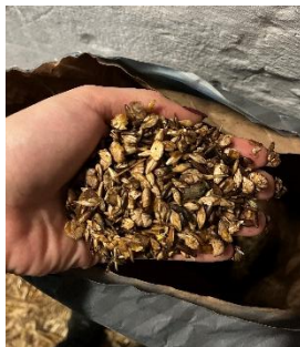
23. ábra: Horse Muesli

A kiegészítők a következők szerint alakulnak a mennyiségekkel együtt: Chevinal 50 ml, Protein-Mineral-Pellets 8dkg, Equi-Salts 3 dkg, Red Mills 20% Red Mills Oat Balancer Cooked Mix 1 kg, Horse Strategy_SL 1kg, NRG XPRO Immuny 1kg, Horse Muesli 1 kg.