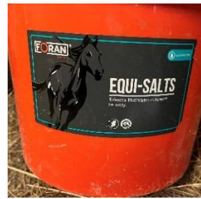
25. ábra: Equi-salts