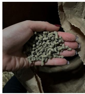
24. ábra: Protein-Mineral-Pellets