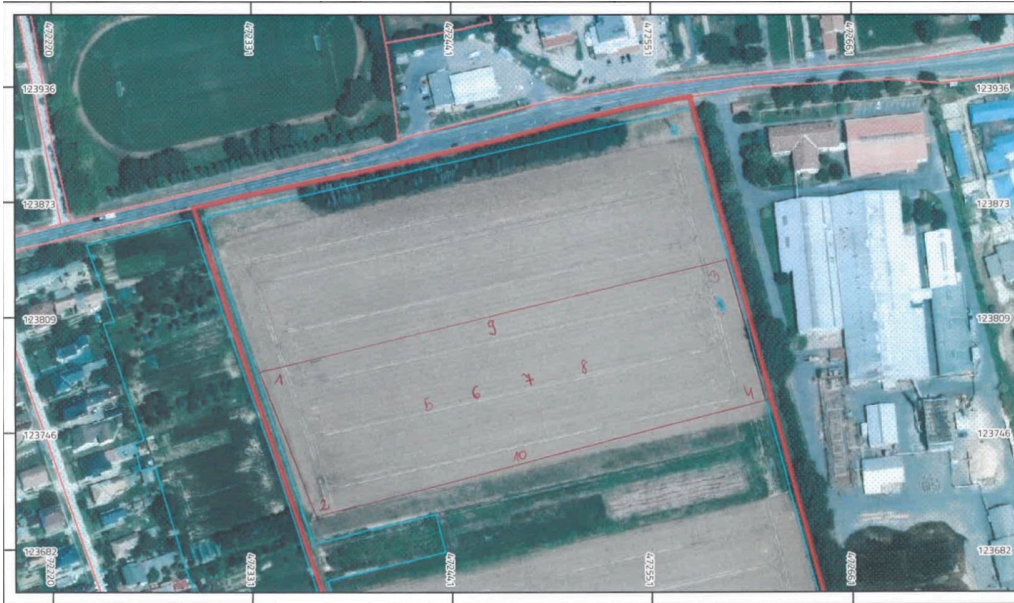
9. ábra: Tábla1