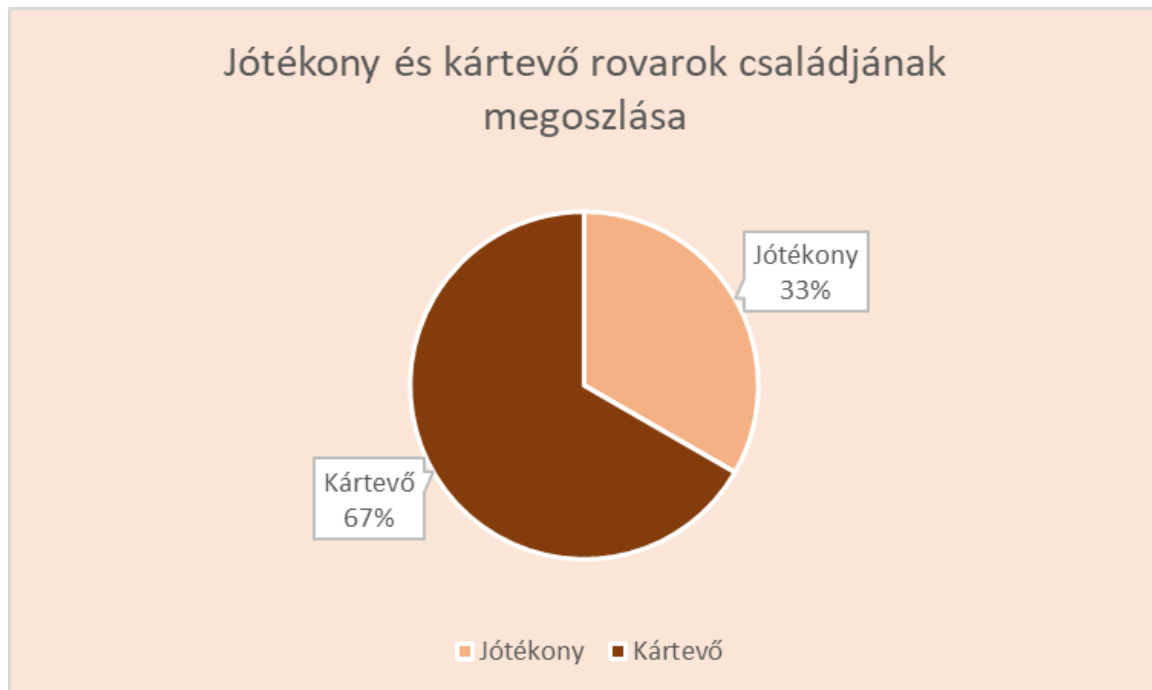
12. ábra: Jótékony és kártevő rovarok családjának megoszlása