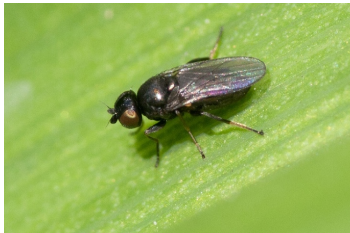
6. ábra: Fritlégy

A fritlégy a gabonalegyek családjába tartozó faj, mely egyaránt károsítja a kalászos növényeket és a kukoricát is. A kis méretű, mindössze 2 mm nagyságú állat nagy problémákat tud okozni. Magyarországon egy tenyészidőszak alatt nagyjából 3-4 nemzedéke fejlődik ki. A telet lárva alakban tölti növényi maradványokban, az első nemzedék imágói nagyjából április-május környékén jelennek meg s tojást is raknak számos növényre. A kikelő nyüvek növényi szövetekkel táplálkoznak, járatokat fúrva a tenyészőcsúcs irányába. Lárva fejlődési ideje 3 hét, majd bebábozódva várja a nyarat, mikor második nemzedéke kirepül. Ilyenkor a kikelő nyű már a termést károsítja a búzán, lyukat fúrnak a szemekbe, így kinyerve a fehérjét és keményítőt a termésből. Bebábozódik ismét s júliusban kirepül a harmadik nemzedék, mely árvakeléseken, korai vetésű búzákon és egyéb fűféléken élnek, itt is vészeli át a telet. Felszaporodásukra tojásrakás idején akkor kell számítani, ha nem hullik sok csapadék, lárvafejlődés ideje alatt pedig, ha több a csapadék és hűvösebb van. A korán érkező őszi fagyok segíthetnek visszatartani a felszaporodás mértékét. (internet11)