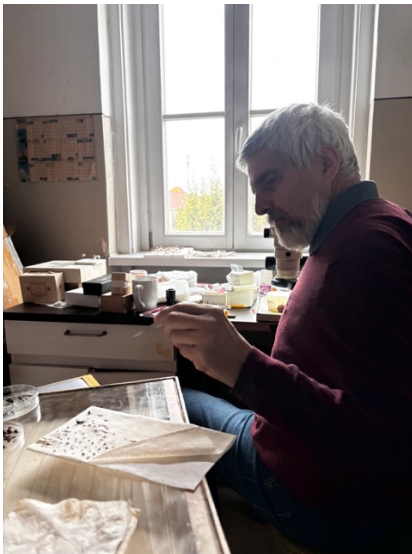
7. ábra: Rovarhatározás.