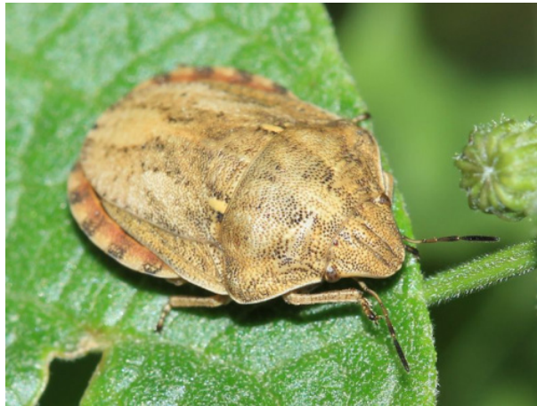
4. ábra: Mórpoloska

Április elején aktivizálják magukat, május elején már tojásokat rak a növényekre. A kikelő nimfák először a zöld részeken, majd pedig a kalászokon szívoogatnak. Augusztus végén, szeptember elején vonulnak telelőhelyeikre. Mivel melegkedvelő fajok, így a száraz, meleg május kedvez nekik igazán. Két egymást követő ilyen év nagy felszaporodással jár, két egymást követő csapadékos május után viszont egyedszámuk csökken, ezzel kártételük is. (internet5)