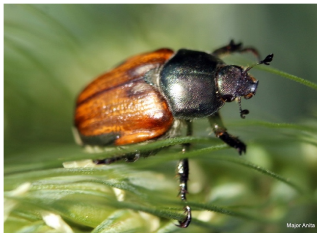
5. ábra: Osztrák szipoly

Fertőzöttség felmérése a pajorok számától függ, például négyzetméterenként 5 db pajor már erős fertőzöttségre utal. Tarlóhántással és a nitrogén-túladagolás csökkentésével mérsékelhető a felszaporodásuk. (internet9)