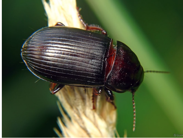
2. ábra: Gabonafutrinka.

globális felmelegedéssel járó enyhébb telek kedveztek nekik, így táplálék bőségében életben tudnak maradni. Kártételük inkább tavasszal szembetűnő, mikor növekedésnek indulnak a búza növények. Szerencsére évente egy nemzedéke van. Amikor 5-6 kifejlett rovart látunk talajcsapdánként, azonnal be kell avatkozni. (internet1)