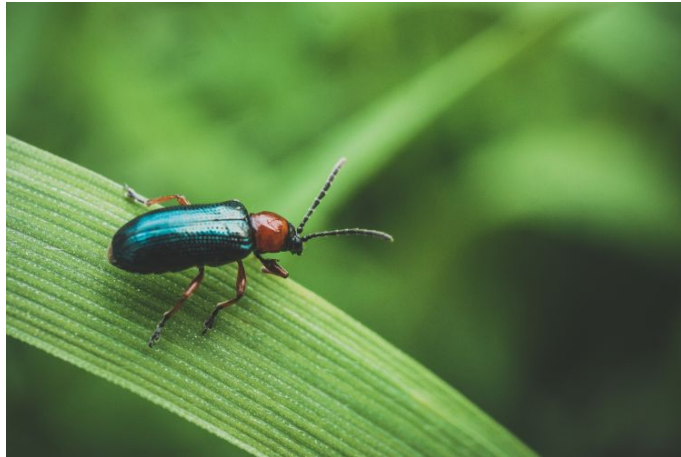
3. ábra: Veresnyakú árpabogár

Június végétől bújnak elő, táplálkoznak őszig, majd a növényi maradványok közt megbújnak. Főként a párás, meleg tavaszok kedveznek a nagy mértékű elszaporodáshoz.