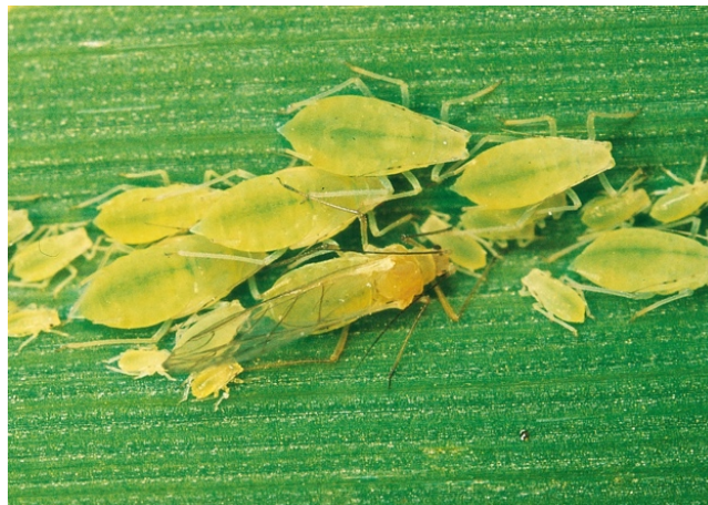
1. ábra: Levéltetvek.

A gabona levéltetvek nem csak önmagukban jelentenek veszélyt kultúrnövényeinkre, ezek a rovarok úgynevezett vírusvektorok, melyek ugyanolyan károsak lehetnek a növényekre nézve. Míg a tetvek szívogatják a leveleket és ennek következtében a fertőzött területek sárgulnak, addig szívókáikon át a vírusok is utat törnek maguknak a növény belsejébe. Ilyen például a sárga törpülés vírus (BYDV), melynek nevéből is sejthetjük, hogy a növényünk lemarad növekedésében társaitól, ezzel akadályozva a normális életfolyamatainak beteljesülését és ezáltal csökkenti a terméshozamot. A levéltetvek főként a leveleken és a kalászon telepekben csoportosulnak. Kártételük nyomán a levelek sárgulnak és pöndörödnek majd elszáradnak, a kalászok elveszítik alakjukat. Azonnali védekezés javasolt ellenük, amint a gabona táblánk több mint 30 százaléka érintett a fertőzésben. (internet1)