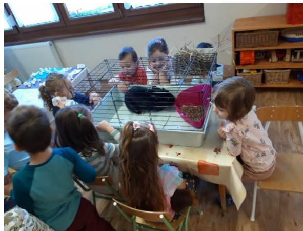
1. kép: Ismerkedés Pufival

Ahogy reggel sorban érkeztek, mindannyian nagy érdeklődéssel vették körül a nyusziketrecet, és nagyon ügyeltek rá, hogy halkán, fegyelmezetten beszélgessenek körülötte. Néhányan mesekönyvet, játékot tettek a ketrec köré, volt, aki mesét is mondott neki, hogy jobban tudjon aludni. A nagycsoportos lányok sorra rajzolták a nyulas képeket. A játékidő után a csoportszoba közepén nagy körben leültem a gyerekeket, úgy, hogy a térdeik törökülésben összeérjenek. Megbeszéltük, hogy hogyan, milyen hangerővel szabad beszélgetnünk. Egy plüssnyuszint gyakoroltuk, hogyan szabad simogatni óvatosan az állatokat a fejtől a farkukig, hogyan érintsük meg őket, úgy, hogy az nekik jó legyen. Megkérdeztem a gyerekeket, mindenki szeretne e a körben maradni, amikor kiviszem a nyulat. Egy kislány van a csoportban, akiről