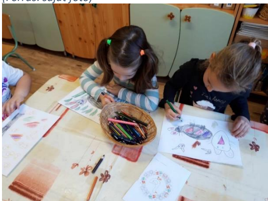
3. kép: Pufi ismerkedik