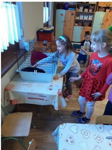
6. kép: Egyre bátrabb nagycsoportosunk