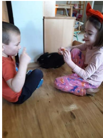
12. kép: Könnyebb a kommunikáció