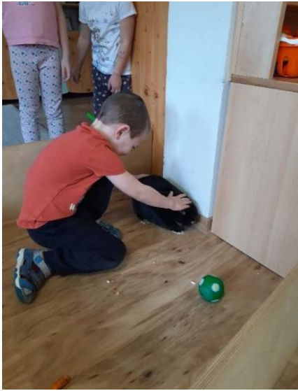
9. kép: Igényli a közelségét