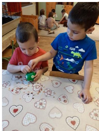
11. kép: Önként vállalt feladat